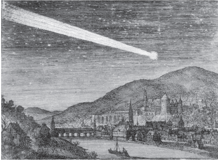
Üstökös Heidelberg fölött 1619-ben