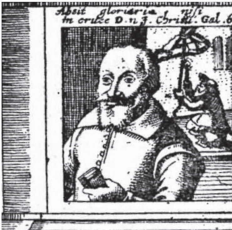
Az ötvenéves Szenci Molnár Albert, háttérben a megkínzás jelenetével