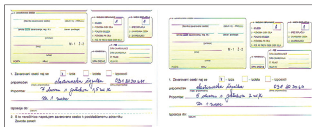
Slika 2. Naročilnica za tehnični pripomoček

Črpalke za enkratno uporabo in s samodejno krčljivim balonom so v Sloveniji dostopne bolnikom z močnimi bolečinami zaradi raka ali posledic zdravljenja raka od julija 2002 kot pravica iz OZZ. Izbrani zdravnik jih predpiše na naročilnico za medicinski tehnični pripomoček za obdobje enega meseca (slika 2). Najuporabnejše so se izkazale eno- in petdnevne črpalke s pretokom 2 ml/uro ter