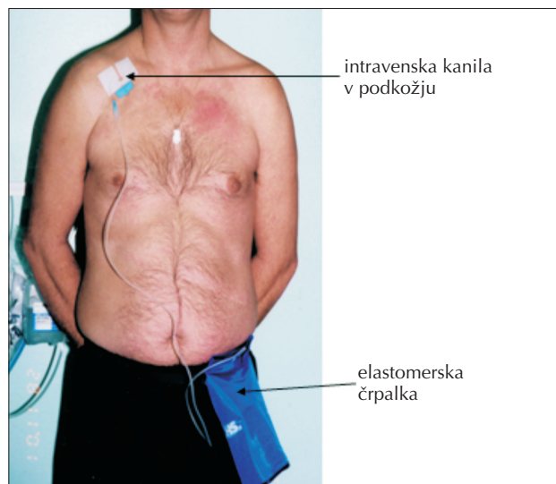
Slika 1. Elastomska črpalka

Bolniku v podkožje sprednjega dela prsnega koša ali trebuha namestimo intravensko kanilo (slika 1). Ta ostane na mestu več dni. Mesto injiciranja zamenjamo, če se lokalno