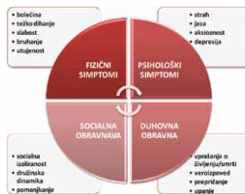
Slika 2. 4D - Paliativen pristop k obravnavi bolnikov z neozdravljivo boleznijo

strokovnjakov različnih strok v PO lahko zagotavlja učinkovito in celostno obravnavo potreb bolnika in njegovih bližnjih (3).