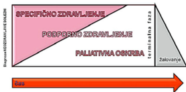
Slika 1. Časovna umestitev paliativne oskrbe v obravnavi onkološkega bolnika z neozdravljivo boleznijo

Glavni namen PO je izboljšati kakovost življenja bolnikov in njihovih bližnjih s pravočasnimi oziroma preventivnimi ukrepi za lajšanje težav: fizičnih, psihičnih, duhovnih in socialnih (slika 2). PO zagovarja življenje in spoštuje umiranje kot naravni proces; smrti ne pospešuje, vendar hkrati tudi ne zavlačuje.