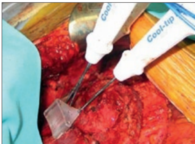
Slika 1. RFA neresektabilnega jetrnega zasevka.

Radiofrekvenčna ablacija (RFA) (slika 1) in krioterapija sta varni in učinkoviti metodi za lokalno zdravljenje jetrnih zasevkov. Uporabni sta pri bolnikih, ki niso sposobni za večje operativne posege, pri neresektabilnih zasevkih ter v kombinaciji s kemoterapijo in resekcijo za boljše doseganje resekcije jetrnih zasevkov z negativnim kirurškim robom (resekcija R0). RFA je kontraindicirana pri zasevkih v bližini jetrnega hilusa, saj lahko povzročimo stenozo žolčevodov. Če je zasevek ob večjih žilah, je zaradi hlajenja prek pretoka krvi v večjih žilah (cooling effect) slabše učinkovita. Relativna