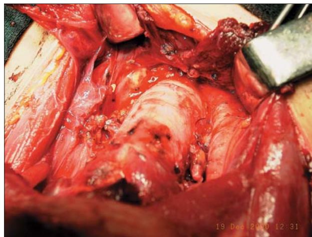
Slika 1. Popolna tireoidektomija (TT) z odstranitvijo bezgavk osrednje vratne lože (CND).

Na Onkološkem inštitutu (OI) smo vpeljali genetsko presejanje bolnikov z MTC v sodelovanju z Laboratorijem za humano genetiko Inštituta za patologijo Medicinske fakultete v Ljubljani na koncu leta 1996. Bolnike z MTC in