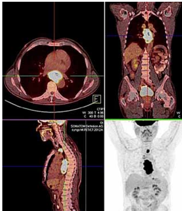
Slika 1. PET-CT pred zdravljenjem

primarnega tumorja in progres bolezni v bezgavkah. Vidno je bilo zvečanje metabolne aktivnosti v že znanih bezgavkah ter na novo v bezgavki ob mali krivini želodca (slika 2).