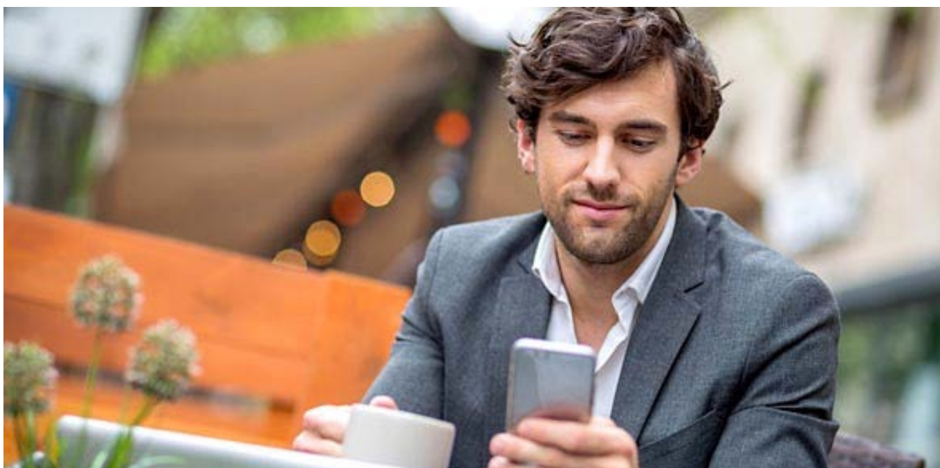
Abbildung 1: Smartphone-Apps sind die perfekten Begleiter für die Arbeit ausserhalb des Büros.

von Flavio Di Giusto und Patrik Scherler