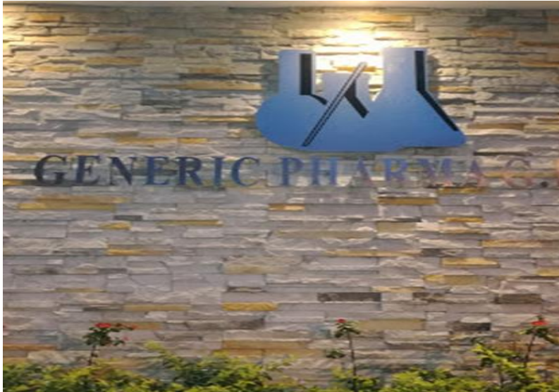
Parte del costado Sur de la Empresa