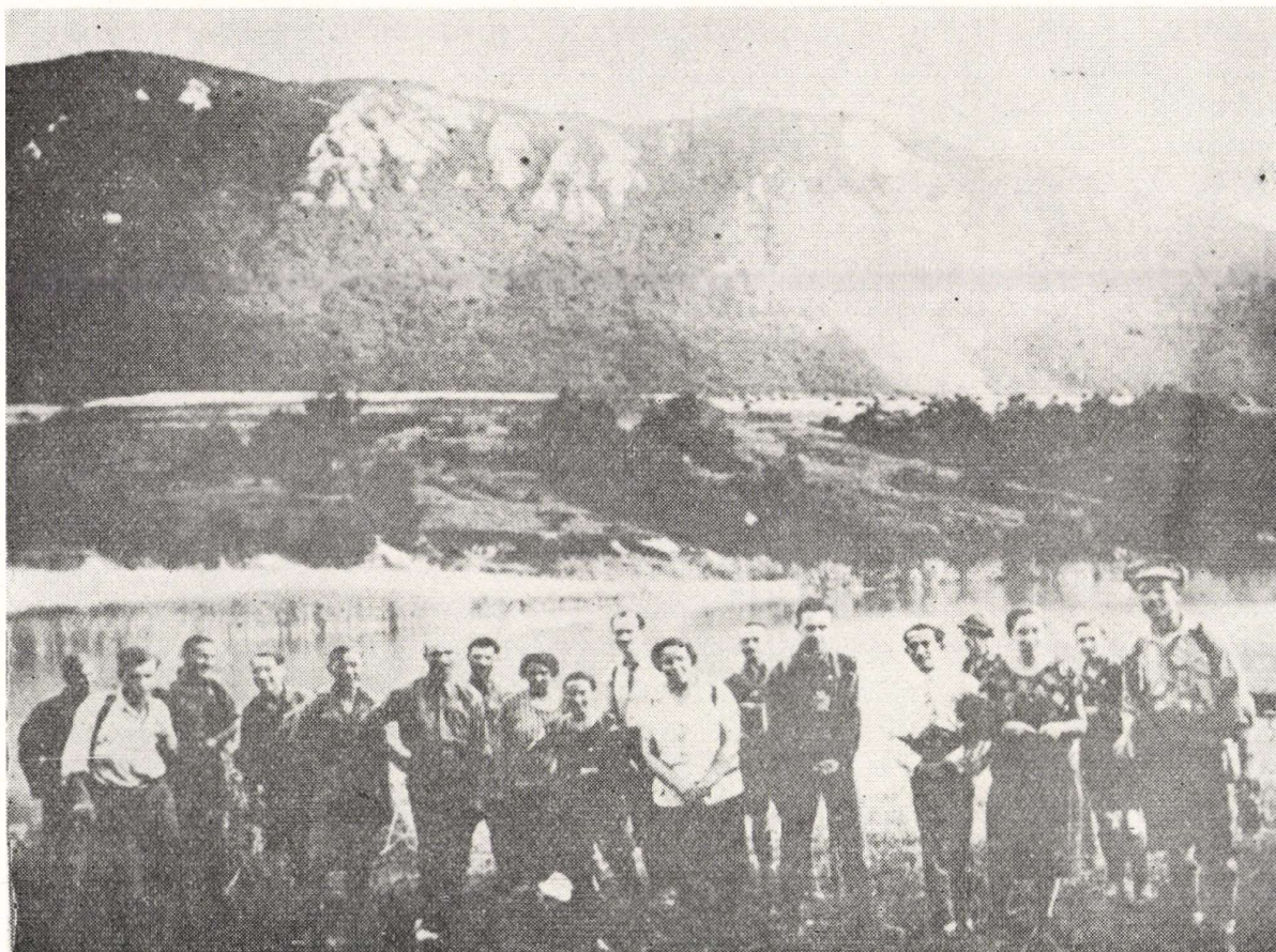
Egri természetbarátok a bélapátfalvi tónál, 1927.

Az 1930-as évek második felében ismeretterjesztő előadásai során leginkább a következő témák szerepeltek: Az ember származása és fajai, Az aranycsinálástól az atomrombolóig, Az őseMBER kultúrája, A babonák és népszokások, Az újkor születése I. (A gazdasági élet átalakulása), Az újkor születése II. (A gazdasági élet átalakulása), Az újkor születése III. (A társadalmi élet átalakulása stb.). Ebben az időszakban Budapesten leginkább a következő helyeken tartott előadásokat: Rákoshegy, Újpest, Pestszentimre, Rákospalota, Kelenföld, Pesterzsébet. Az előadások zöme munkásotthonokban hangzott el, egyszerű munkáshallgatóság előtt. Sok előadását összekapcsolta diavetítéssel, s más szemléltető eszközök felhasználásával. Előadásai marxista szemléletűek voltak, természettudomá-