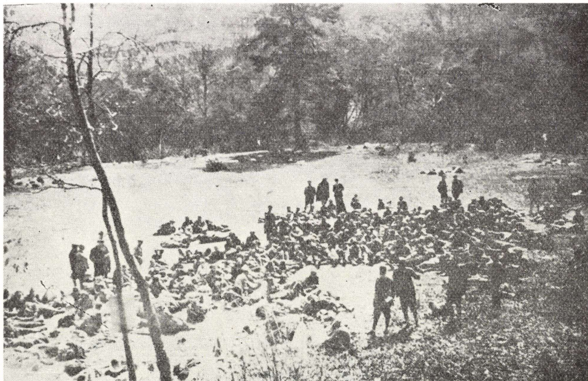
A Természetbarátok Turistaegyesületének 1928. április 8-i bakonyi vándorgyűlésének egyik szónoka volt