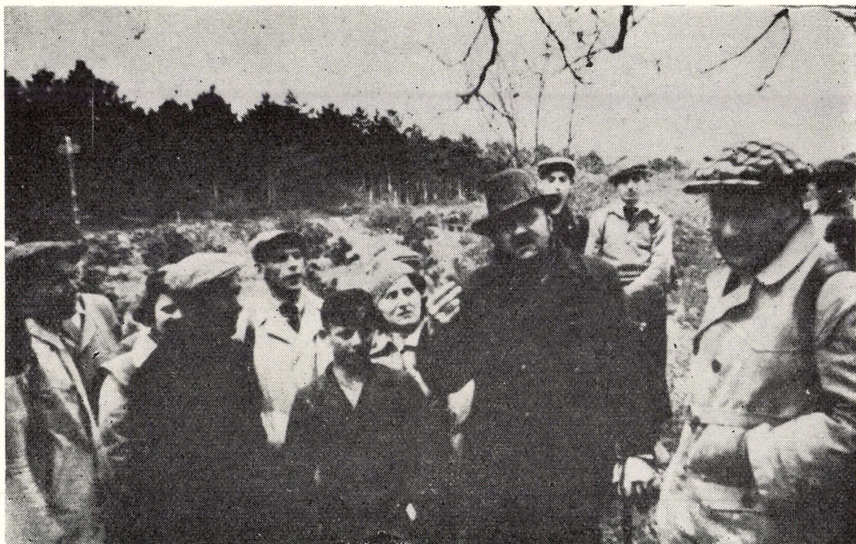
A budai Mátyás-hegyen tanítványai között, 1938. április 10-én