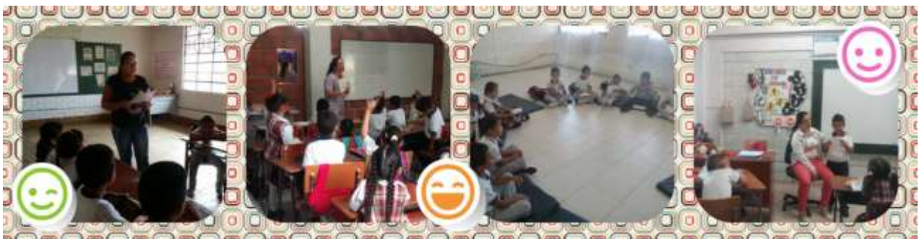
Figura 4. Interacciones lingüísticas con el texto.

Las subactividades partieron de la lectura de cuentos haciendo uso de la práctica textual y las interacciones lingüísticas antes, durante y después del cuento, que los niños tuvieran la forma de hacer sus propias creaciones artísticas, partiendo de las inferencias, análisis e interpretaciones que surgieron como es el caso de la lectura de cuentos como primera subactividad, y las interacciones entre el texto y el niño, como segunda subactividad.