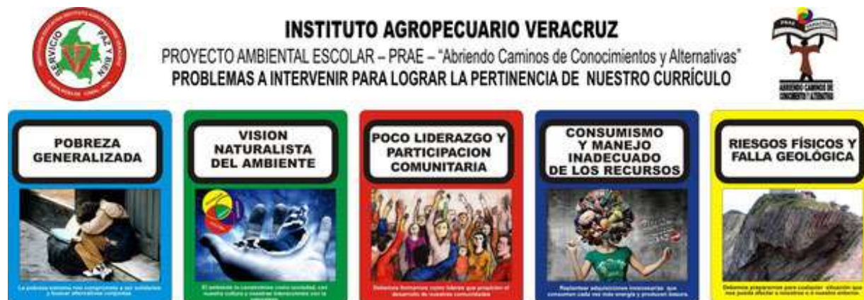
Figura 2. Problemáticas del PRAE