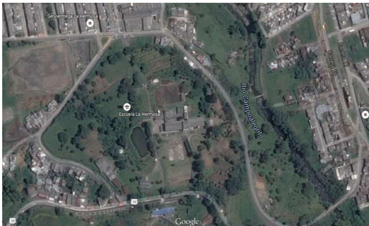
Figura 1. Ubicación geográfica de la institución