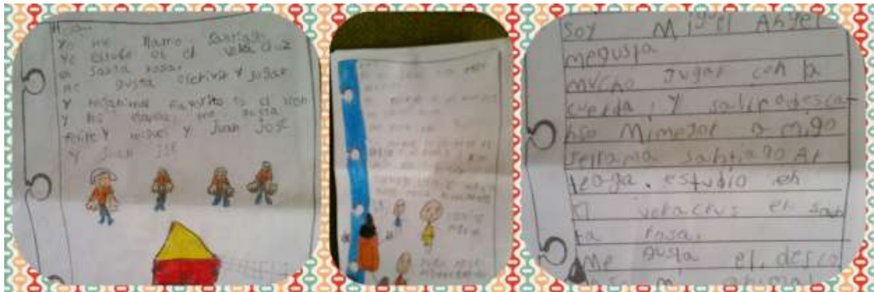
Figura 5. Producciones escritas.