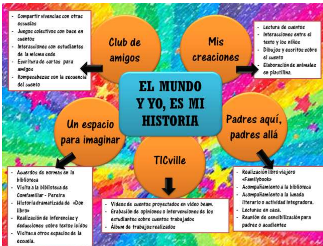
Figura 3. Actividad integradora y núcleos tópicos.