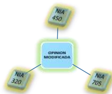
Grafico 1. Relaciones de las NIA's con la modificación de la Opinión

Este último determinará si las evidencias sustentan una modificación de la opinión en el dictamen sobre los estados financieros debido a deficiencias materiales de importancia relativa; tomando en consideración en el análisis la NIA 320 (Importancia relativa en la planeación y realización de una auditoría) y la NIA 450 (Evaluación de las representaciones erróneas identificadas durante la auditoría), puesto que tienen un vínculo con las situaciones en el control interno que modifican el dictamen del auditor. En el grafico 1. Relaciones de las NIA's con la modificación de la opinión se puede apreciar esta relación.