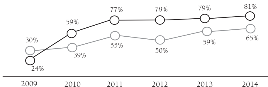
Gráfico 1. Uso de canales o medios electrónicos para obtener información, o realizar trámites, u obtener servicios, o presentar peticiones, quejas o reclamos o participar en la toma de decisiones