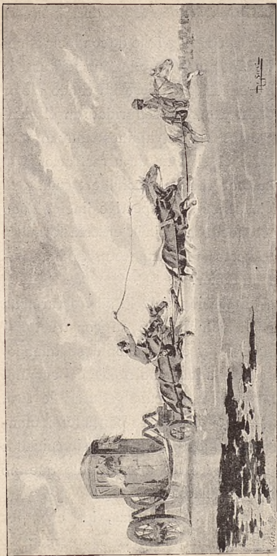
GALERA DE VIAJE.