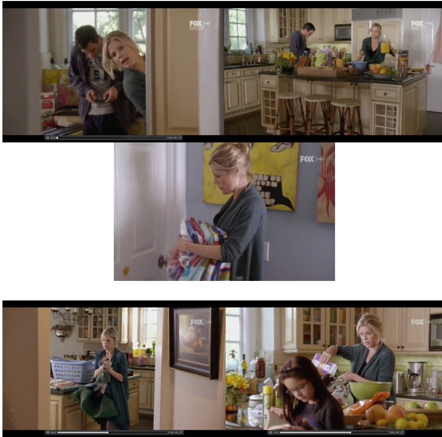
Figura 2. Claire Dunphy realiza las tareas propias del hogar ante la indiferencia de su familia.