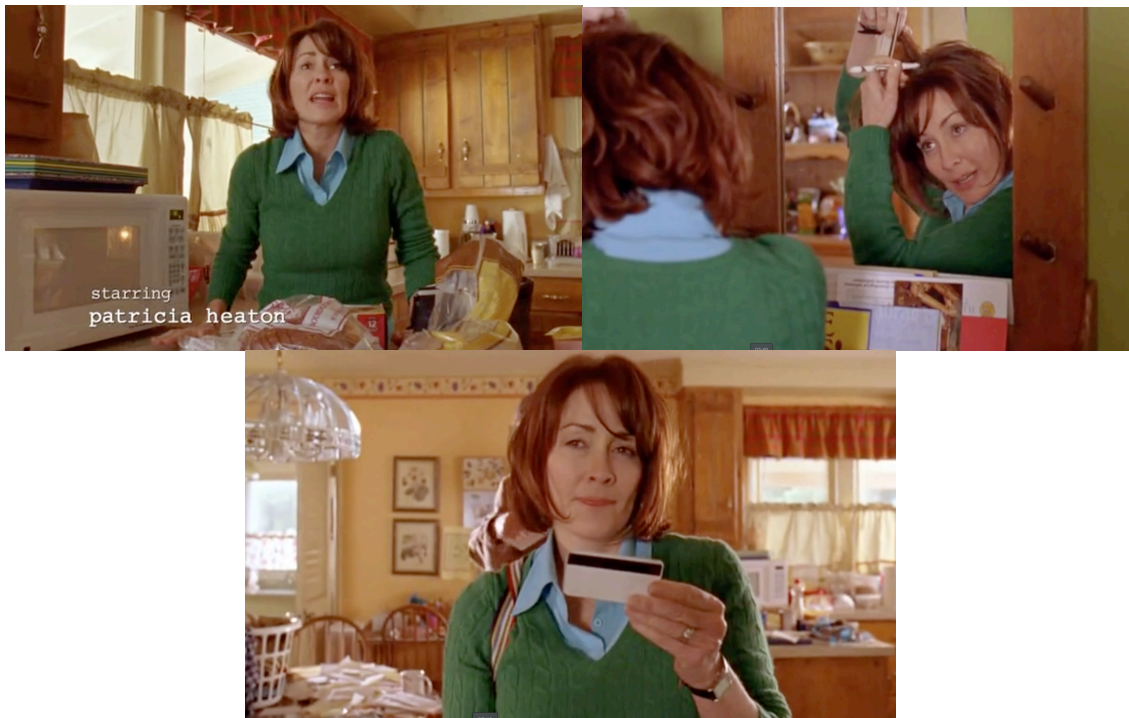
Figura 5. La representación de Frankie Heck en el episodio piloto. La imagen de la madre de familia pone de manifiesto su estresante vida cotidiana.