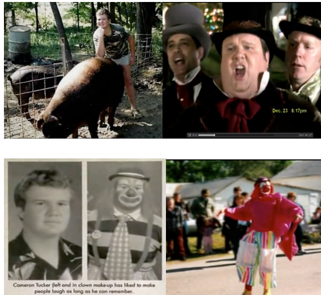
Figura 4. Algunas referencias que expone Cameron

cuando habla de sus habilidades y de los recuerdos de pasado. Integración de la experiencia personal en el ámbito familiar.