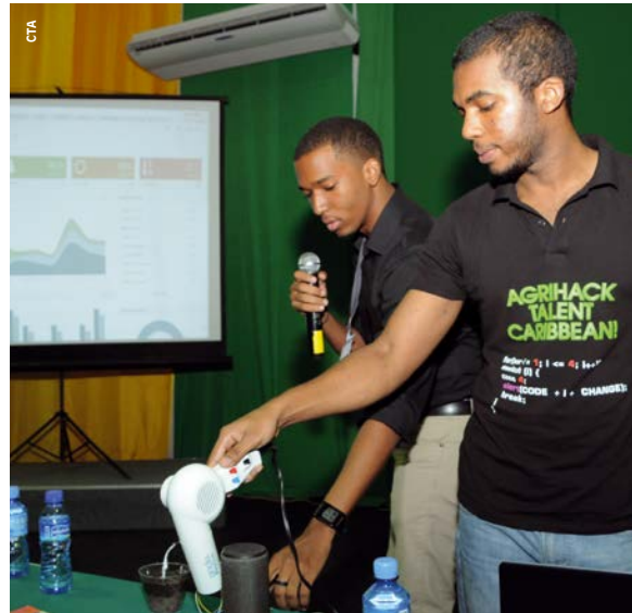
La photo sur la droite : Lauréats du concours AgriHack Talent aux Caraïbes en 2014.

Les applications portant sur le segment de la consommation sont relativement récentes et les possibilités d'en créer de nouvelles restent à explorer. Un exemple est Chowberry au Nigeria (anciennement Foodrings) qui vise à lutter contre le gaspillage alimentaire par le biais de la mise à disposition d'une plateforme afin de récupérer de la nourriture pour les groupes défavorisés.