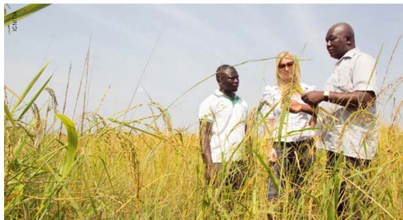
Des agriculteurs témoignent auprès de l'équipe d'Ignitia : leurs récoltes ont augmenté grâce aux meilleures prévisions.

Les développeurs d'Ignitia sont partis du principe que des symboles de nuage, de pluie et de soleil aideraient les utilisateurs sous-alphabétisés et analphabètes à comprendre les prévisions météorologiques. Outre ces symboles, chaque prévision était également notée sur une échelle de 1 à 3 en fonction de sa fiabilité, mais ces chiffres prêtaient à confusion. Ignitia a alors pris la décision de former les utilisateurs plutôt que de retirer les indications chiffrées du message de peur que ce dernier ne soit interprété, à tort, comme un choix arbitraire