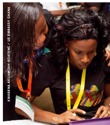
TechCamp West Africa 2015, à Accra, au Ghana. Lors de ce type d'événements, de jeunes innovateurs entrent en contact avec différentes parties prenantes, telles que des investisseurs providentiels, en vue d'étendre leur réseau professionnel.

De nouvelles opportunités de collecte de fonds ont vu le jour dernièrement. Un investisseur providentiel, par exemple, est un particulier fortuné qui désire investir son capital personnel dans une société en échange de fonds propres. Ce type d'investisseur finance généralement une start-up dans sa phase d'amorçage. Si des investisseurs providentiels investissent en groupe, ils peuvent alors créer un fonds d'investissement ou un consortium. Outre le capital qu'il met à votre disposition, l'investisseur providentiel peut également faire profiter votre start-up de son expérience et de son réseau. Si certains investisseurs sont des experts en matière de création d'entreprise, d'autres sont de jeunes fondateurs, qui ne possèdent peut-être pas encore les connaissances suffisantes pour aider votre société. Essayez d'entrer en contact avec d'autres start-up figurant dans le portefeuille de cet investisseur, afin de vous assurer que cette personne vous conviendra. L'avènement et la croissance relative des