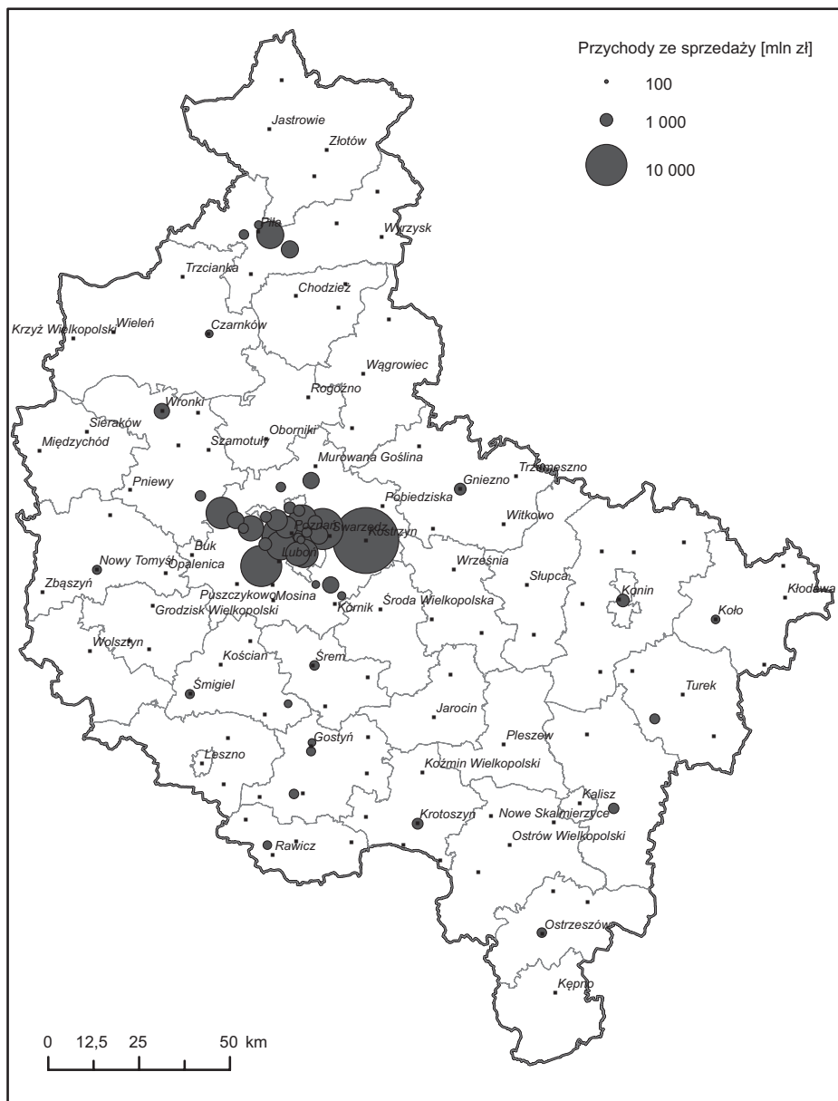
Ryc. 1. Lokalizacja i przychody największych przedsiębiorstw w województwie wielkopolskim w 2011 r.