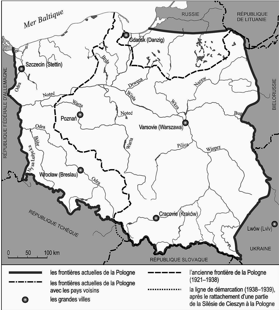
Fig. 1. Les frontières polonaises au cours du XX e siècle

Prusse-Orientale (la partie nord de ce territoire a été incorporée à l’Union soviétique constituant la circonscription de Kaliningrad (Königsberg)). La conscience de l’appartenance des terres de l’Ouest à la Pologne n’était pas proche aux Polonais et elle était plutôt ressentie en tant que récompense pour les réparations de guerre de la part des Allemands et une compensation de la perte des territoires orientaux au profit de l’Union soviétique (voir: A. Moraczewska, 2008).