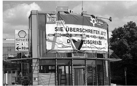
Photo 1. La présentation visuelle et textuelle des informations en langue allemande à Słubice, près du pont-frontière, vue sur Francfort-sur l'Oder; texte de la publicité: „Sie überschreiten jetzt die Preisgrenze – Vous êtes en train de passer la frontière de prix”.

En 1993, les dernières troupes soviétiques ont quitté la Pologne et l'armée polonaise a subi une réorganisation. Ainsi, de cette manière des zones considérables de la ville „ont été libérées” et adaptées à de nouvelles fonctions socio-économiques (voir: K. Kulczyńska 2006, K. Kulczyńska 2011).