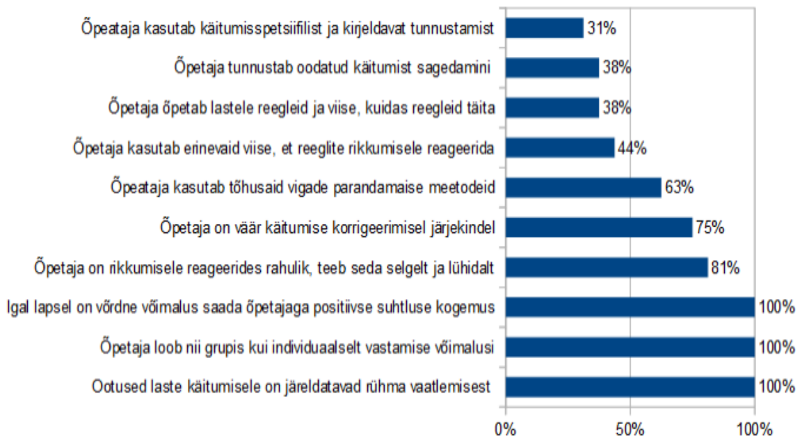
Joonis 1. Õpetajate tegevus rühmas- vaatluste ajal

Kolmanda uurimusküsimuse raames, milliseid sotsiaalseid oskusi ja kuidas õpetajad toetavad enda sõnul , täitsid õpetajad küsimustiku (Lisa 3) ja vastasid küsimustele: palun nimetage sotsiaalseid ja enesekohaseid oskusi, mida peate oluliseks oma rühma lastele igapäevaselt õpetada ja palun nimetage emotsionaalseid ja käitumisraskusi, mis häirivad Teie rühma tööd . Tulemustest ilmnas (vt Joonis 2), et õpetajad – pidasid kõige olulisemaks toetada kolme laste oskust: oskust teistega arvestada (68% õpetajatest), eneseteenindusoskust (64% õpetajatest) ja reegli- ja normikohast käitumist (61% õpetajatest). Üle poolte õpetajatest pidasid oluliseks toetada ka oskust küsida abi (57%) ja oskust tulla toime konfliktidega (54%). Kõige vähem, ainult 18% õpetajatest, pidasid oluliseks toetada laste kohanemist rühmas. Kõige häirivamaks lapse käitumisraskuseks, pidasid õpetajad just eneseregulatsiooni raskusi (61%) ning agressiivset käitumist (43%). Veel toodi välja impulsiivset käitumist (36%), reeglite ja normide eiramist (25%) ja erivajadusi (11%), kui rühma tööd häirivaid käitumisraskusi.