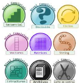
Figura 3. Insignias incorporadas a la plataforma

Desde el menú principal se agregará un botón Logros. Debe llevar a una pantalla que muestre en gris las insignias pendientes de obtener y con color aquellas que ya ha ganado el alumno.