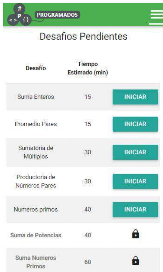
Figura 1. Pantalla de Desafíos Pendientes – Tercer Nivel

La plataforma está en uso desde el primer cuatrimestre del 2016 (su desarrollo puede profundizarse en [6]).