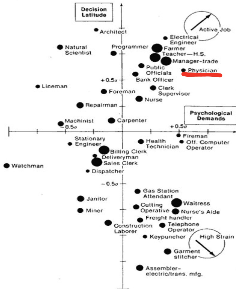
FIGURE 2-2 The occupational distribution of psychological demands and decision latitude (U.S. males and females, N = 4,495)