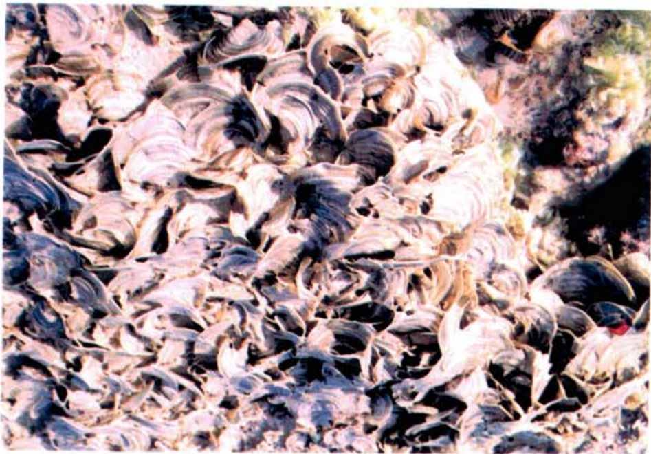
شکل ۴: Padina australis Huck