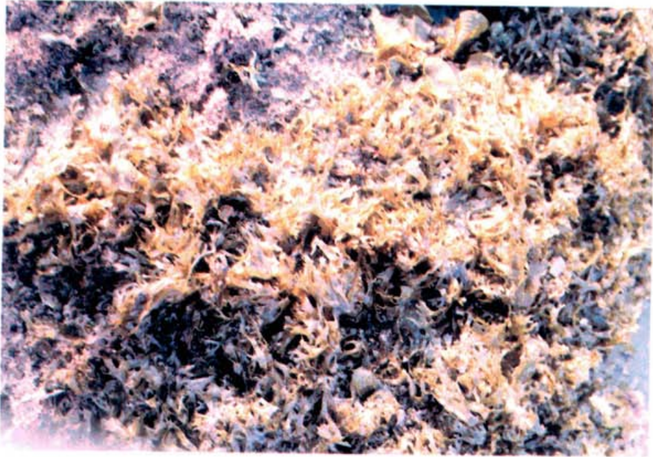
شکل ۳: Dictyota sp.