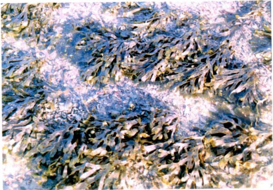
شکل ۲: Stoichospermum marginatum J.Agardh

۱۳ تا ۱۵ متری به بعد صخره‌های مرجانی پدیدار می‌شدند و در مناطق دیگر حداکثر تا عمق ۶ متری صخره‌ای و تا عمق ۸ تا ۱۰ متری صخره‌ای ماسه‌ای و از آن به بعد تبدیل به ماسه‌ای گلی می‌شدند. لازم به ذکر است که کلیه اندازه‌گیری‌های عمق بطور متوسط در نظر گرفته شده است، یعنی عمق‌ها در دو زمان جزر و مد اندازه‌گیری شده و حد واسط آنها محاسبه گردیده است. نمونه‌های برداشت شده بصورت فصلی از بستر دریا، مربوط به سه گروه جلبکهای سبز، قهوه‌ای و قرمز بوده و تعداد این نمونه‌ها ۴۱ گونه بوده که ۳ گونه آن مربوط به جلبکهای سبز، ۱۶ گونه مربوط به جلبکهای قهوه‌ای و ۲۲ گونه مربوط به جلبکهای قرمز می‌باشد. اسامی جلبکهای مزبور در جداول ۲ نشان داده شده است.