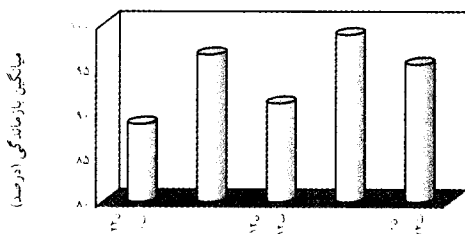
مدت زمان نوردهی در یک شبانه روز

نمودار ۳: مقایسه اثر سطوح مختلف دوره‌های تابش نور بر بازماندگی مرحله جوانی میگوی ببری سبز