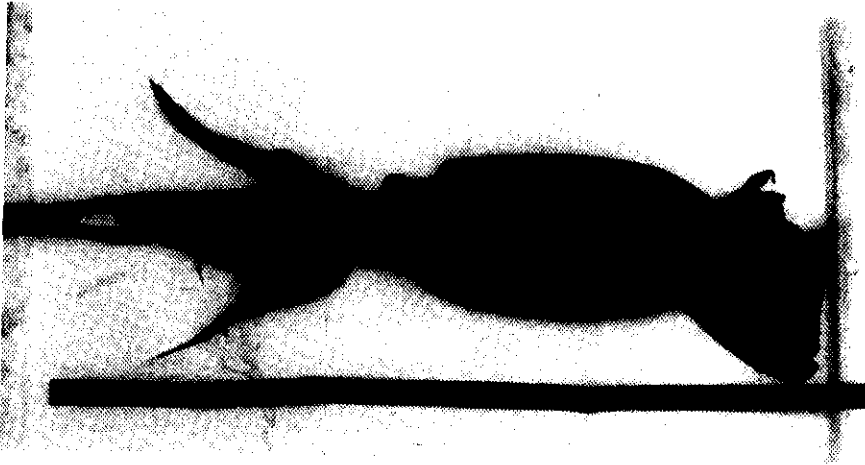
شکل ۱: اسکوتید پشت ارغوانی خارج شده از معده تون زرد باله

در این مطالعه ۵۴۶ معده و محتویات آن به تفکیک جنس مورد بررسی قرار گرفت. غذای ترجیحی تون زردباله در دو جنس نر و ماده به ترتیب با ۶۰ درصد و ۵۷ درصد متعلق به گونه اسکوتید پشت ارغوانی ( Sthenoteuthis oualaniensis (Purpleback flying squid) بود که در بسیاری از معده‌ها به طور سالم و هضم نشده خارج گردید (شکل ۱).