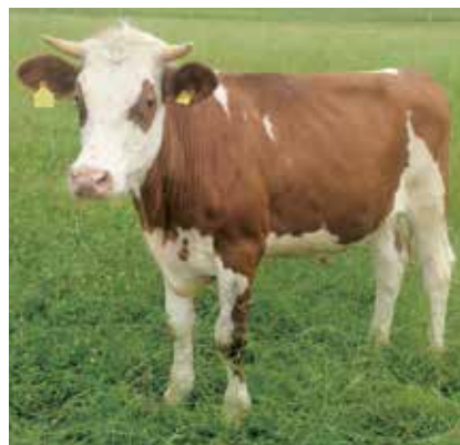
Enfin un écoulement bio pour les veaux des races laitières.

Les fermes laitières qui participent doivent garder leurs veaux au moins cinq mois (175 à 200 kilos de poids vif) dans la ferme de naissance et leur donner 700 à 800 kilos de lait. Les veaux mâles sont castrés à l'âge de dix jours pour pouvoir aller au pâturage. À cinq mois le système immunitaire des veaux est stable. Ils peuvent alors être transportés dans une ferme bio d'engraissement au pâturage sans subir de problèmes sanitaires. Ils sont vendus à 175 kilos à une ferme d'engraissement (d'après le prix de revient complet, le prix total de 1292 francs comprend 280 francs pour le travail de 6 minutes par jour à 25.- Fr./h.). La fin de l'engraissement impose au moins huit heures de pâture pendant la période de végétation, parcours quotidien en hiver, stabulation libre et litières confortables. Le fourrage de base est constitué d'herbe, de silo d'herbe et de foin. Il faut éviter si possible les concentrés. En plaine, le maïs est autorisé jusqu'à la limite pour la PLVH. Une production basée sur les herbages est possible dans les zones de montagne car les bêtes ont jusqu'à l'âge de 30 mois pour atteindre