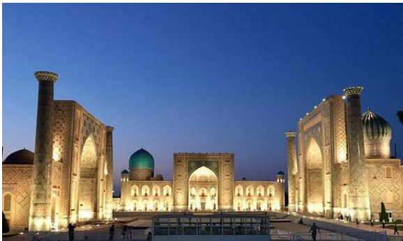
Figura 1. Registán

Uno de los paisajes más fantásticos en el Asia central, que definieron las reglas básicas de la arquitectura islámica entre el mediterráneo y el subcontinente indio. La palabra Registán significa «lugar de arena», dado que fue construido sobre el lecho seco