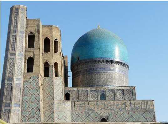
Figura 2. Capsula de la Mezquita de Bibi Khanum