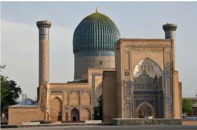
Figura 4. Mausoleo Gur-E-Amir Autor: ("Samarcanda-Mausoleo Gur e-Amir", 2014) actualmente se encuentra en su situación primitiva.

Gur-e Amir significa en persa "Tumba del Rey", es donde está enterrado el conquistador Tamerlán. Es uno de los monumentos mejor conservados de la ciudad, fue restaurado por la URSS y