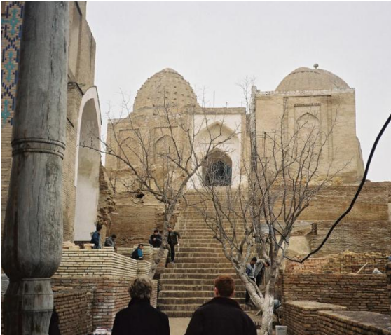
Figura 3. Entrada a la Necrópolis Shah. I. Zinda