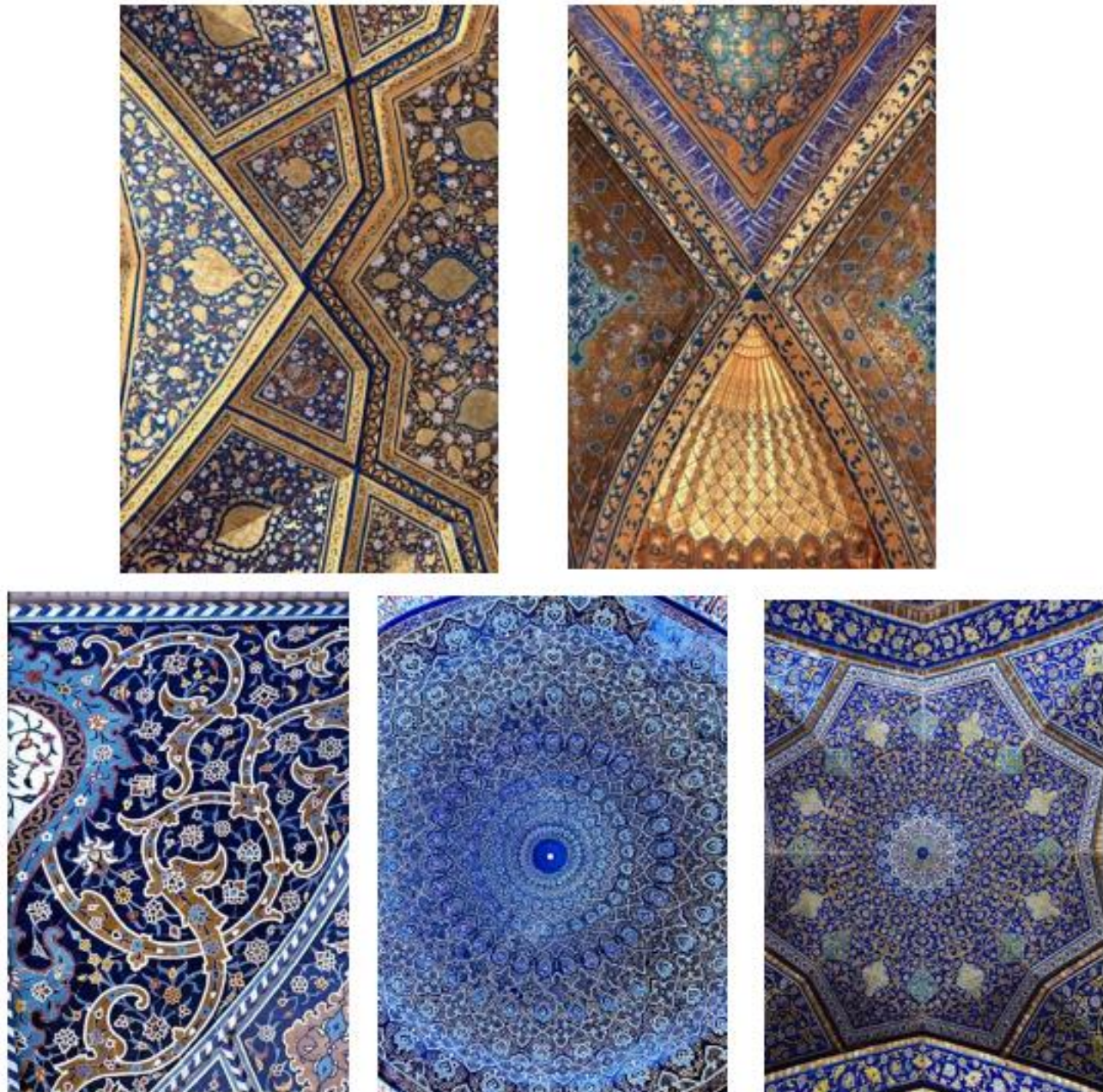
Figura 7. Estructuras Ornamentales

Autor: (Guidebook of history of Samarkand, s.f)