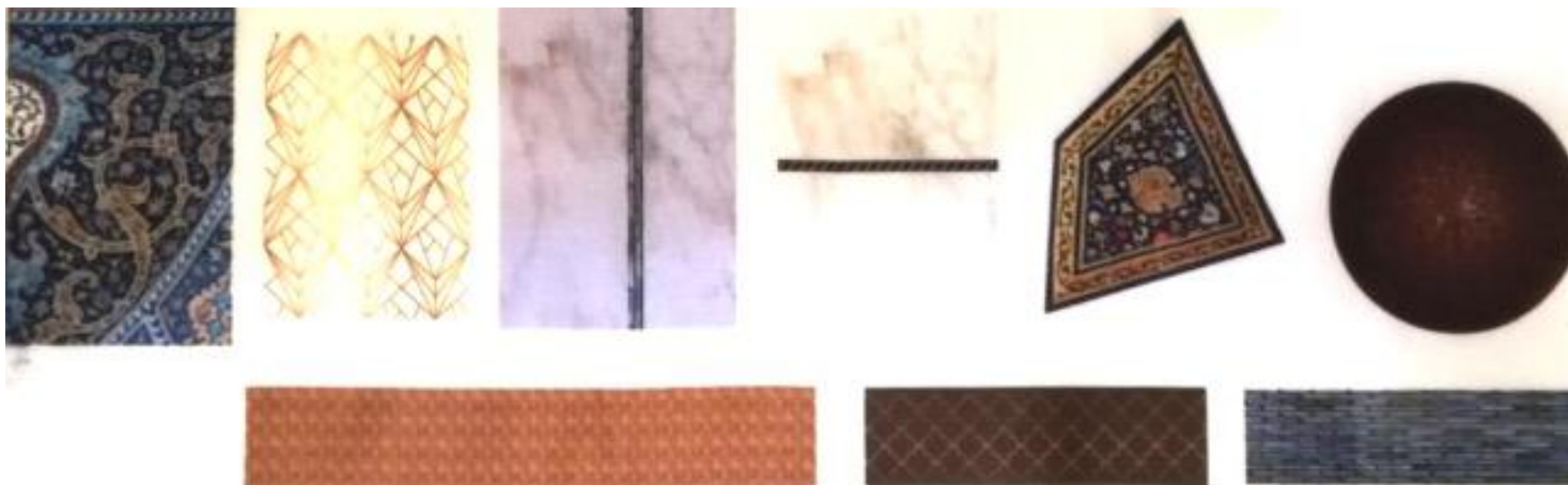
Figura 12. Proceso práctico de producción Autora: Jhordana Ulloa