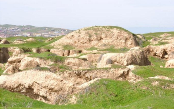
Figura 5. Ruinas de Afrasiab Autor: ("AFRASIAB. zona norte de Samarkanda. Uzbekistán.", 2010)