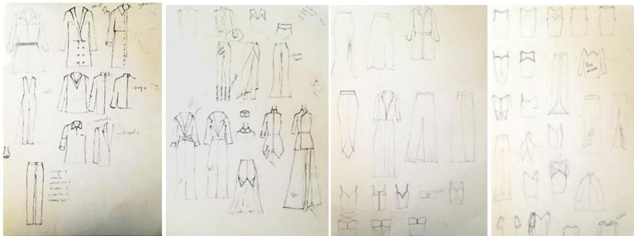
Figura 9. Fuentes Primarias