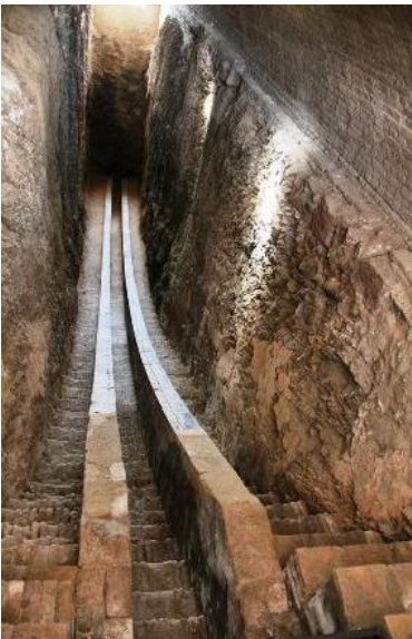
Figura 6. Observatorio Ulugh Beg

Sextante mural de Ulugh Beg, construido en Samarcanda, durante el siglo XV.