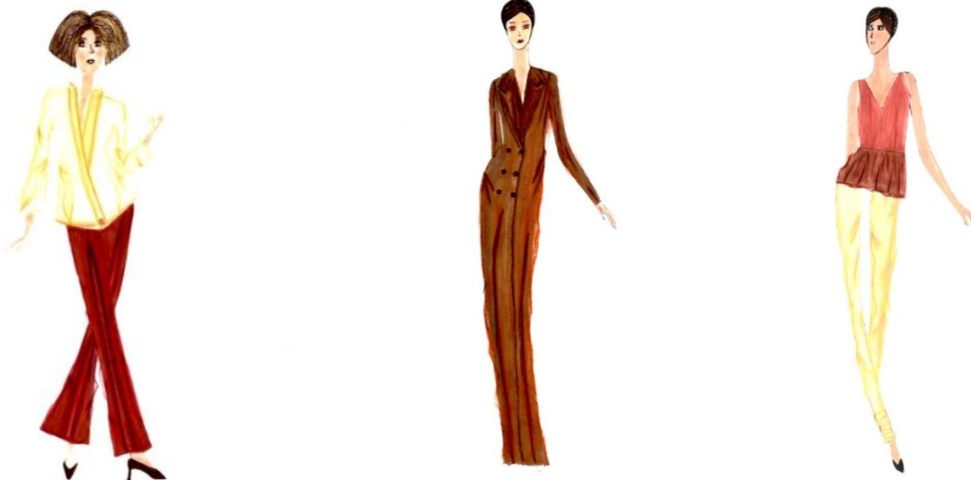
Figura 10. Ilustraciones Autora: Jhordana Ulloa