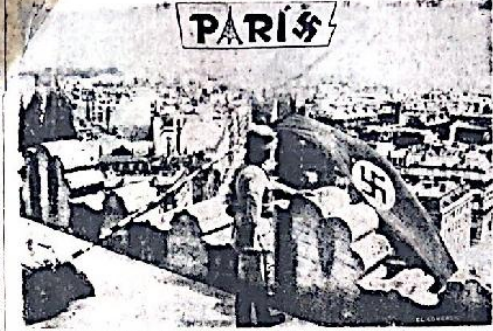
Un soldado francés contempla la capital francesa desde la alto del Arco del Triunfo en donde flama la bandera con la cruz gamada del nazismo.

LA CIVILIZACION EUROPEA YACE BA- JO EL CARRO TRIUNFAL DEL NACISMO