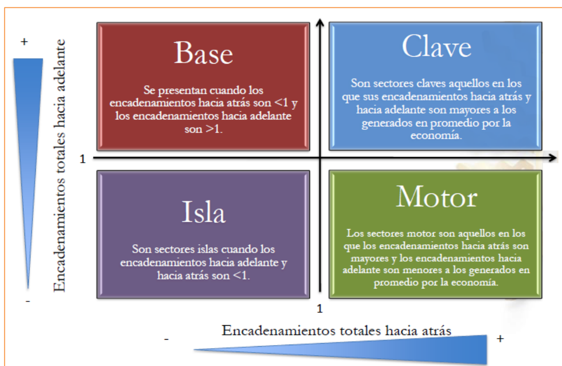
Gráfico 4. Clasificación de los sectores por encadenamientos totales

El gráfico 4 resume toda esta información.