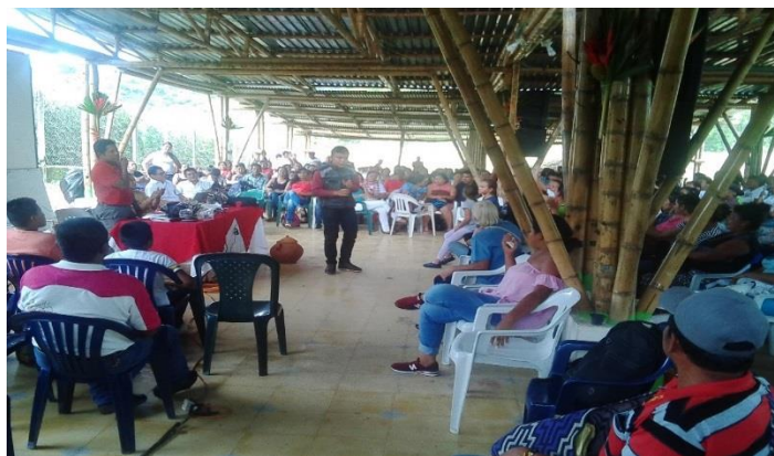
Fotografía. Asamblea del cabildo

La Asamblea que tiene como función direccionar el territorio. de acuerdo con el gráfico anterior, se puede inferir que el órgano máximo de autoridad en la Comunidad es la asamblea conformada por todos los cabildantes y sus delegados nombrados por sus respectivas comunidades, directiva del cabildo central, el consejo del gobierno, áreas, secretarías y consejería indígena.