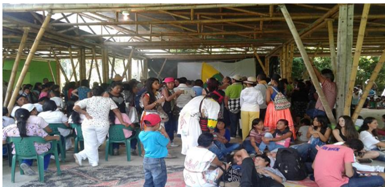
Fotografía 1. Reconociendo, el concepto de educación, desde una mirada historia a través del escenario Cultural y Organizativo.