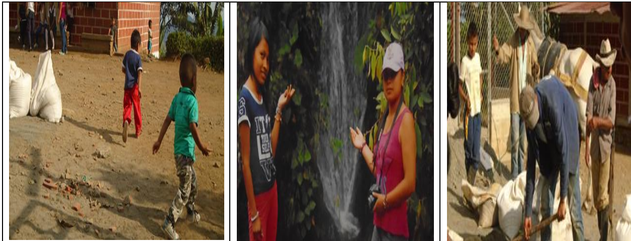
Institución Educativa Veneros, Cascadas Bermejales.

la Educación es: “El proceso donde todos enseñamos y todos aprendemos, lo cual considera el territorio como el mayor pedagogo” .