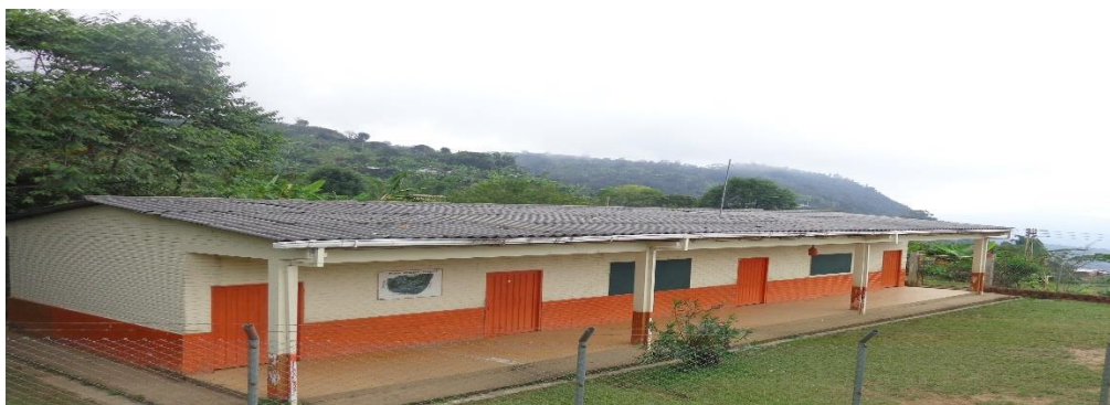
Fotografía Escuela sede Piedras.