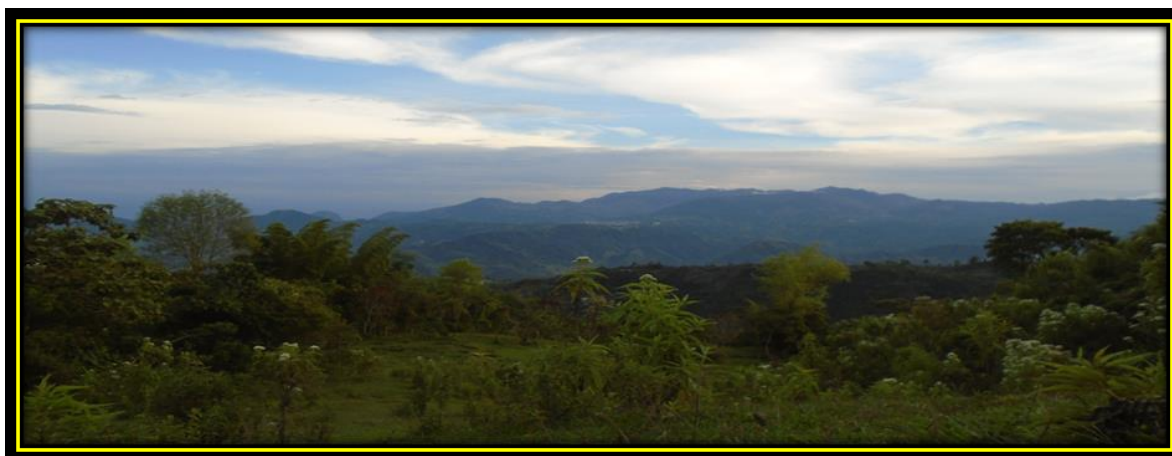
Comunidad de Bermejál.

Y especialmente a Dios por bendecirme cada día, y porque en ÉL siempre hay esperanza.