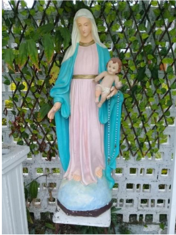
Virgen del Rosario ubicada en la Institución.