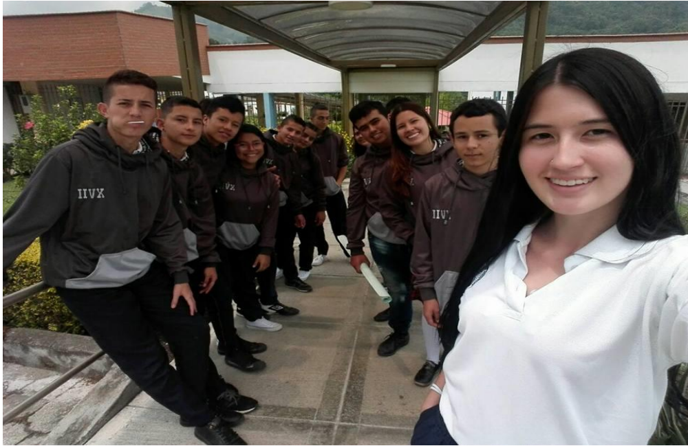
Integrantes semillero de investigación.

Como primer proceso que se llevo a cabo dentro de la organización del semillero, fue la realización de un carnet, que fue diseñado por ellos mismos, con el fin de que el grupo se identificara frente a la institución, iniciativa que sirvió de apoyo a los estudiantes de otros grupos, para quienes se les hiciera necesario identificarlos al momento de buscarlos y hacerles entrega de fotos o algún documento que sirviera de aporte al proyecto.