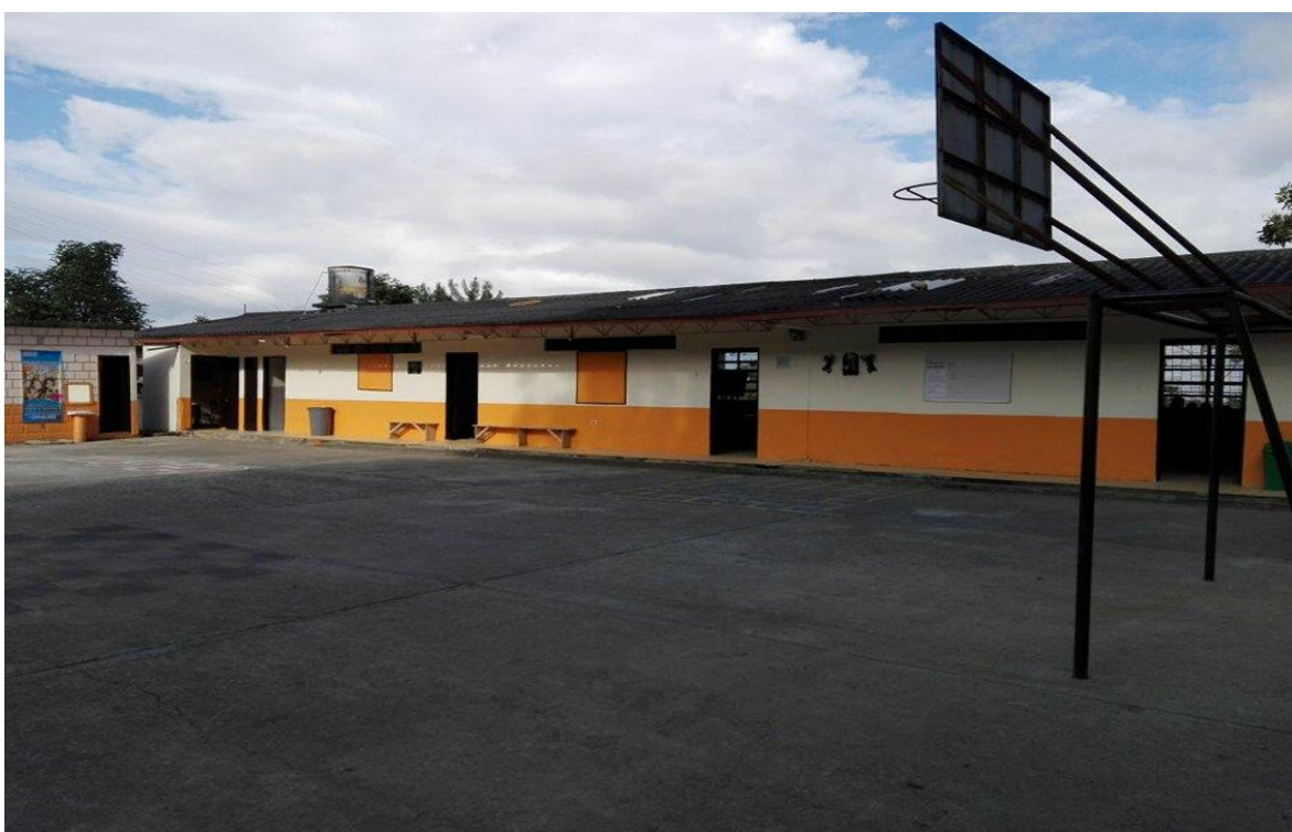
Escuela 12 de Octubre- Vereda Tejares

En el año 2009 se obtiene la resolución de aprobación de estudios en todos los niveles de educación, resolución N° 5830 del 27 de noviembre de 2009, además se anexa una nueva sede ubicada en la vereda Tejares del municipio de Villamaria (12 de octubre) Sede 6 desde el 14 de marzo del mismo año.