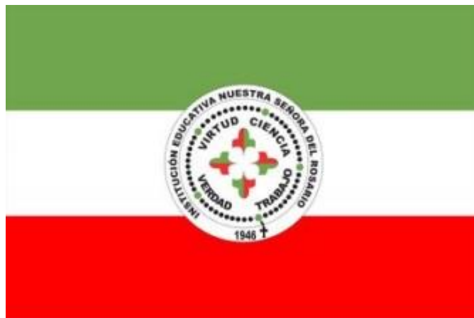
Bandera - I.N.S.R