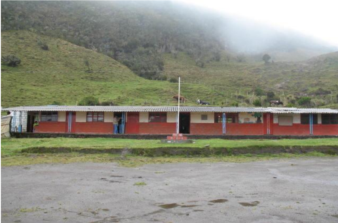
Escuela A.S.P.A.R- Vereda la Laguna