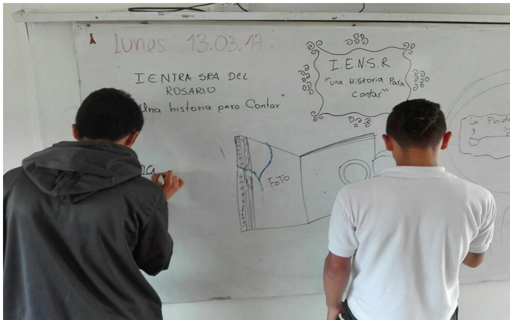
Estudiantes diseñando el carnet del semillero.

Como primer proceso que se llevo a cabo dentro de la organización del semillero, fue la realización de un carnet, que fue diseñado por ellos mismos, con el fin de que el grupo se identificara frente a la institución, iniciativa que sirvió de apoyo a los estudiantes de otros grupos, para quienes se les hiciera necesario identificarlos al momento de buscarlos y hacerles entrega de fotos o algún documento que sirviera de aporte al proyecto.