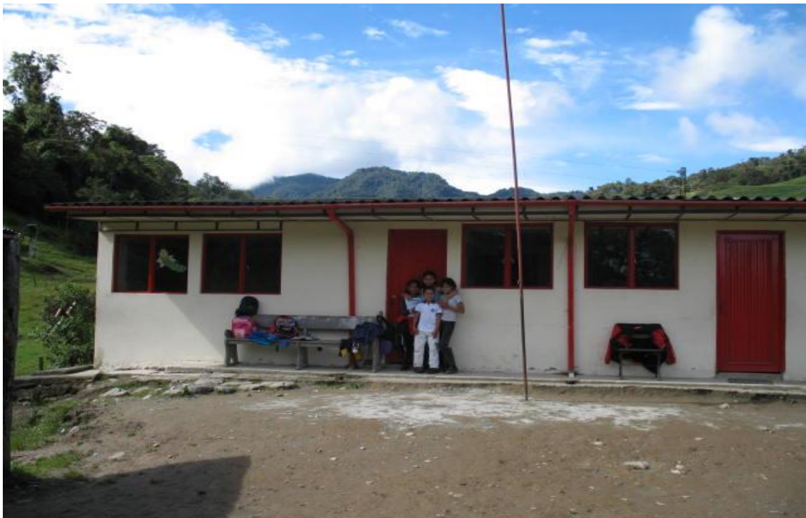
Escuela Montaña- Vereda Montaña