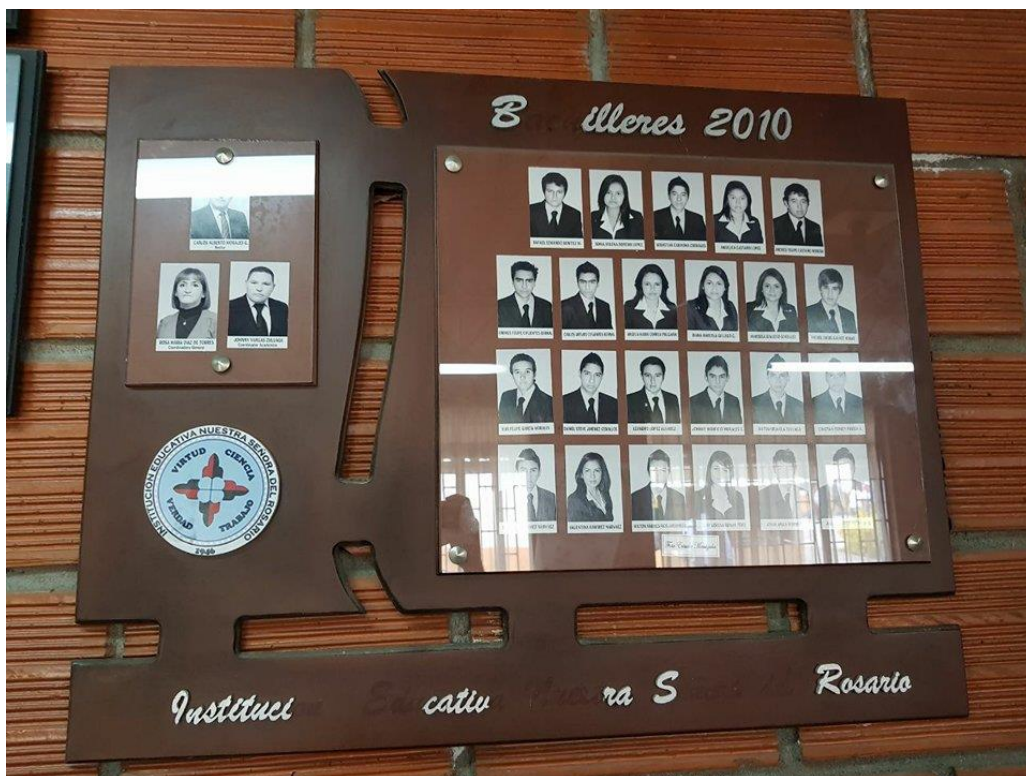
Primera Promoción De Bachilleres- I.N.S.R.

En el año 2011 la institución se vincula en la formación de docentes para la implementación de un Sistema de Gestión de Calidad y fue recomendada para la certificación con el ICONTEC Norma ISO 9001:2008 en las respectivas auditoria de otorgamiento.