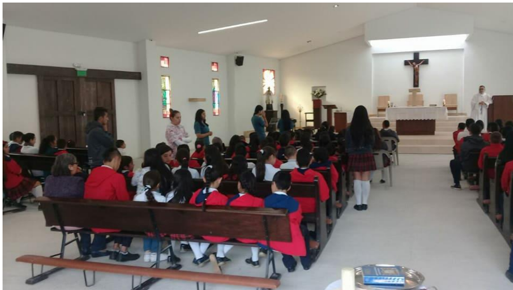
Celebración eucarística- Capilla San Juan María Vianey.