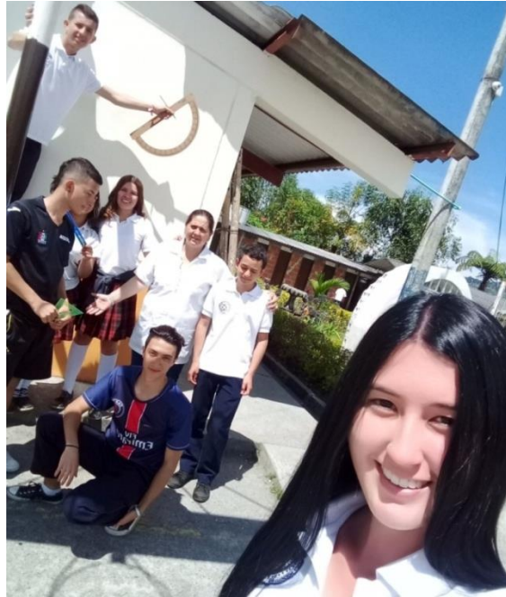
Estudiantes en la elaboración del mural