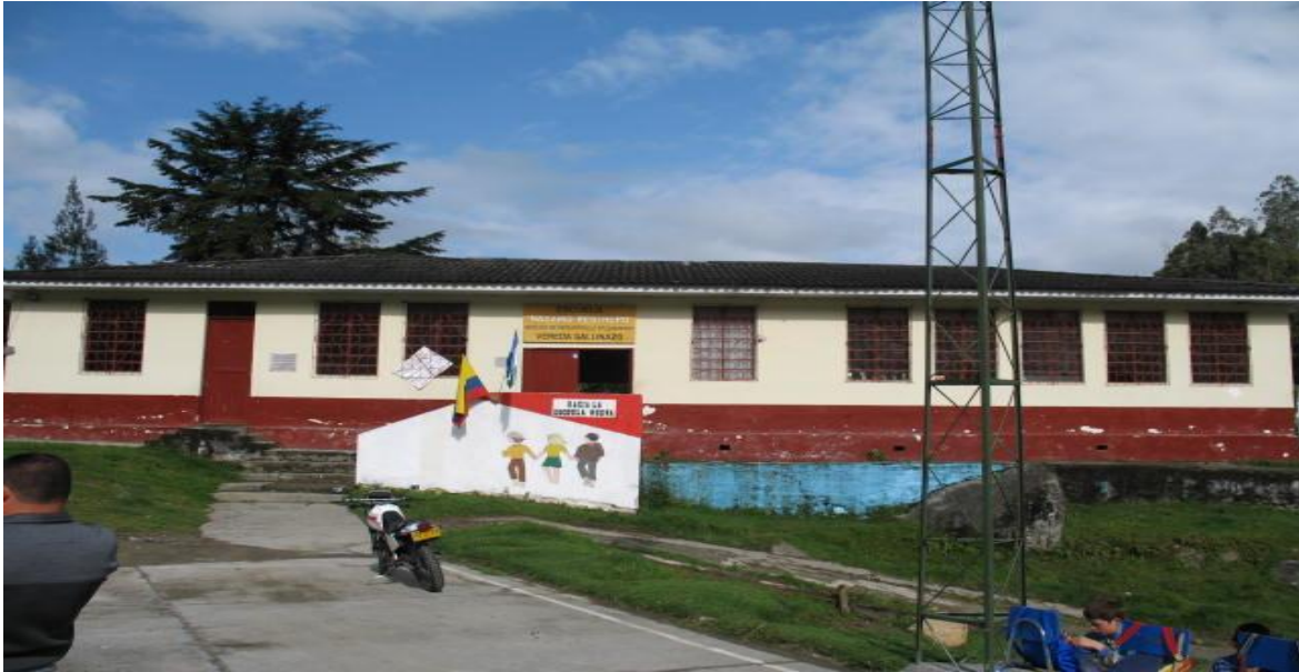
Escuela Nazario Restrepo- Vereda Gallinazo