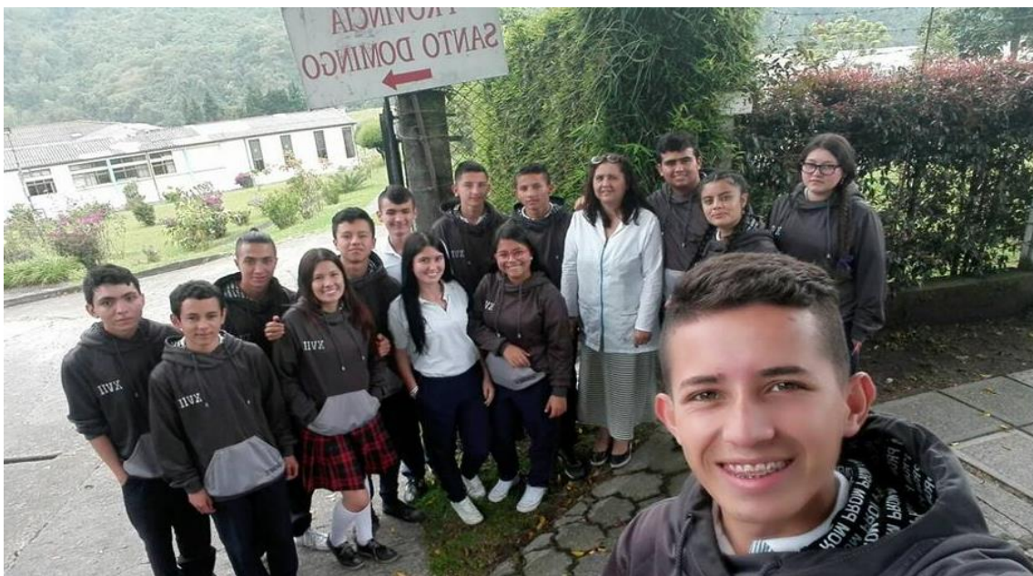
Visita exploratoria a la congregación de las hermanas dominicas

hacerlo, también se realizaron muchas llamadas sin éxito, visitas en las cuales no se obtuvo mucha información de peso, lo cual, llevo a momentos de frustración, pero que aun así no lograron desanimar a los estudiantes quienes siguieron adelante llevando a cabo actividades por medio del proyecto que lograron dejar huella en la institución.