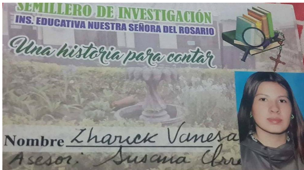
Diseño final-Carnet del semillero.

Como semillero de investigación, demostraron algunas características específicas que los llevo a una realización satisfactoria del proceso para llevar a cabo el proyecto: