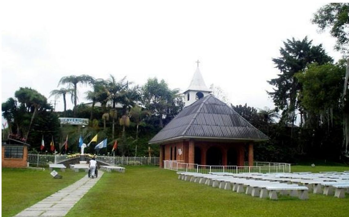
Santuario de la Virgen de las Naciones.

aproximadamente de 6 kilómetros, tiene como vía de acceso la carretera Panamericana que la comunica con la Villamaria y los barrios Enea y Lusitania del municipio de Manizales teniendo dos formas de acceso: por lusitania desde la panamericana, al liceo anglo francés capilla San Juan María Vianey, o por la vía Pintucales. Alto de la Virgen, santuario de la Virgen de las Naciones.