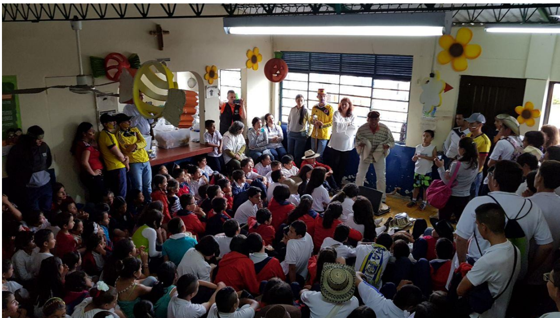
Foto Cuento en la Institución- Narrativa cuento sobre la I.N.S.R

En el marco de las fiestas patronales y la celebración del cumpleaños de fundación de la institución, se reunió toda la comunidad educativa a escuchar de voz del cuentero, la narración de la historia de la institución, el lugar no fue el más ideal, pero debido a las malas condiciones climáticas, fue imposible realizar la actividad en el patio del colegio, aun así el cuentero logro captar la atención de grandes y chicos, gracias a su particular carisma, quienes al final abordaron con preguntas de la institución que él supo responder. El impacto de esta actividad fue máxime pues los estudiantes a pesar de estar incómodos, se mostraron felices al escuchar esta narración.