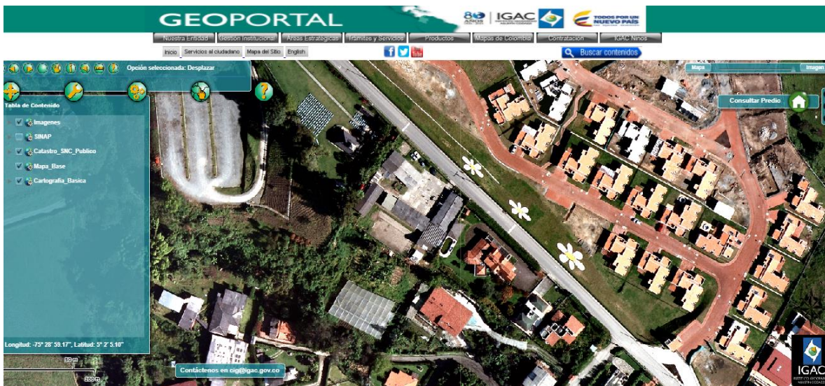
Panorámica vereda la florida