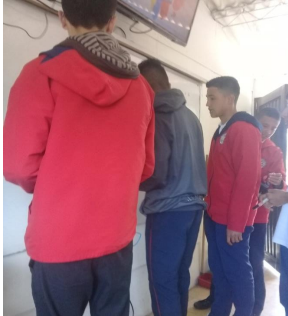
Estudiantes diseñando el borrador del mural

investigado sobre la institución, seguidamente se realizó una selección de los estudiantes que tuvieran más habilidad para el dibujo para iniciar el proceso de diseño en el aula de un borrador o bosquejo en donde los estudiantes plasmaron su imaginario de que aspectos que para ellos deberían ir plasmados en el mural.