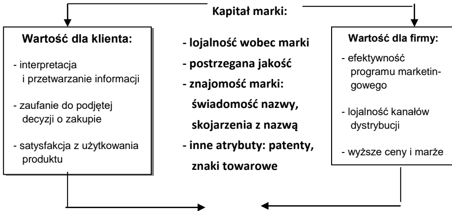
Rys. 1. Elementy kapitału marki i tworzone przez nie wartości dla klientów i firm.

nie wyższych marż. Na rys. 1 pokazano elementy tworzące kapitał marki i dostarczające określoną wartość zarówno dla nabywcy, jak i dla przedsiębiorstwa.