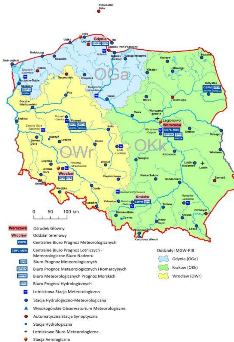
Rys.1. Sieć obserwacyjno-pomiarowa IMGW