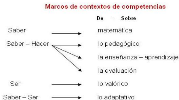
Ilustración 1. Integración de las competencias ciudadanas, con el contexto para formar estudiantes como constructores de paz y convivencia escolar.

Durante los meses de marzo y julio del año 2004 el MEN realizó una jornada nacional de talleres con el objetivo de socializar el Programa de Competencias Ciudadanas. De acuerdo con los resultados de la evaluación se estableció que los promedios obtenidos fueron porcentualmente bajos, debido a que sólo: el promedio correspondiente a competencias cognitivas para el grado noveno supera los 6,5 puntos en una escala de 10; el promedio más bajo es el de conocimientos para grado quinto, con un puntaje de 5 ”. Con lo cual se indicó que conjuntamente los promedios y las desviaciones estándar para cada una de las dimensiones: “se observa que los conocimientos de los estudiantes (...) presentan bajos promedios y altas dispersiones, lo que quiere decir que en general no sólo los estudiantes no dominan los conceptos necesarios para el ejercicio de la ciudadanía, sino que además existen grandes diferencias entre lo que saben unos y otros estudiantes” .