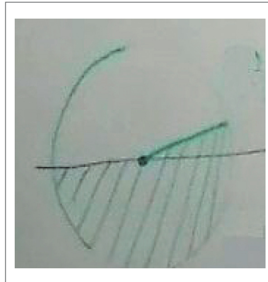
Figura 1. Diagrama circular de los votos de Santos.

con la equidad de género. El profesor explicó en el tablero cómo calcular los grados correspondientes a la circunferencia de acuerdo con la proporción de votos obtenida por cada candidato. Luego el profesor dibujó en el diagrama circular la porción correspondiente al candidato Santos, como se muestra en la figura 1, y pidió a una estudiante que dibujara la porción correspondiente a 70.20° en el diagrama, es decir, la porción del candidato Mockus.