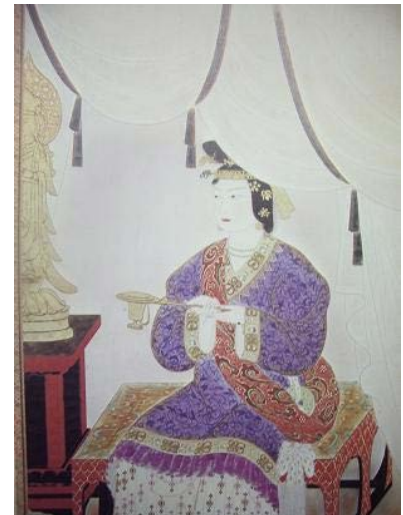
Kaiserin Suiko (554–628 n.Chr.), dritte und jüngste Tochter von Kaiser Kinmei und seiner Gemahlin Soga

Der Suiko Vulkan liegt auf ca. 45° nördlicher Breite und ca. 170° östlicher Länge und befindet sich damit im Bereich der subarktischen Front, die als 4°C-Isotherme in 100 m Wassertiefe definiert wird und die ungefähre Grenze zwischen den windgetriebenen, gegenläufig drehenden subtropischen und subarktischen Wirbelsystemen darstellt. Der Vulkan ist insofern interessant, als dass wir uns weiterhin erhoffen, auf den in relativ geringen Wassertiefen liegenden Gipfelbereichen gute Sedimente gewinnen zu können. Tatsächlich sind wir nicht die ersten, die hier geologisch arbeiten. Schon das Bohrschiff „Glomar Challenger“ führte hier Ende der siebziger Jahre eine Bohrkampagne durch mit der Intention, die vulkanische Entwicklungsgeschichte der Emperor-Vulkankette zu untersuchen. Im Jahr 2001 gewann dann das französische Spezialforschungsschiff „Marion Dufresne“ einen ersten paläozeanographisch interessanten Sedimentkern von ca. 44 m Kernlänge, der bislang unbearbeitet blieb.