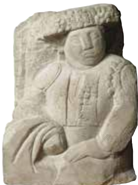
Fig. 4. Manolo Hugué, Torero , 1913. MNAC 010219

punt de venda comercial de ceràmica i vidre, cristalleria, perfums i tota mena d'objectes de fantasia i de regal. Entre 1916 i 1918, cal consignar algunes exposicions agitadaes pels aires avantgardistes propiciades per Salvat Papasseit (1894-1924), director de la llibreria de les Laietanes. Rafael Barradas (1890-1929), l'introduïdor del futurisme, hi celebrava la primera exposició individual que ell anomenava 'vibracionista'. Hi va exposar, també, Joaquim Torres-Garcia, tres anys abans de marxar cap a Nova York desil·lusionat per la incomprensió del seu projecte artístic; el fauve salmantí Celso Lagar (1891-1966), instal·lat a Blanes; Daniel Guardiola (?), pintor caigut en l'oblit i, aleshores, qualificat de promesa fauve; Lluís Bagaria (1882-1940), amb les seves caricatures, així com les creacions de l'etapa de Ceret de l'escultor Manolo Hugué (1872-1945), aplaudides en els ambients artístics perquè s'ajustaven als ideals clàssics i mediterranis (fig.4). Fonts primàries conservades donen algunes pistes del sistema de treball del marxant Segura