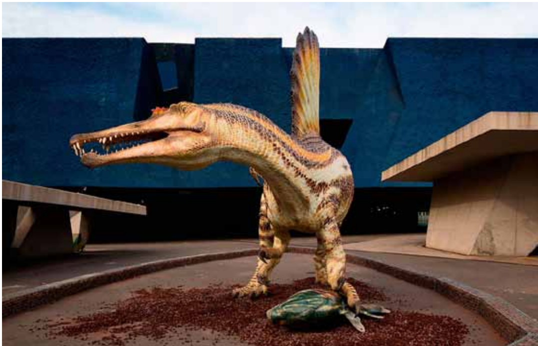
Model d' Spinosaurus a mida real situat a l'esplanada d'entrada al Museu de Ciències Naturals de Barcelona.

ció mitjançant la visita del públic general.