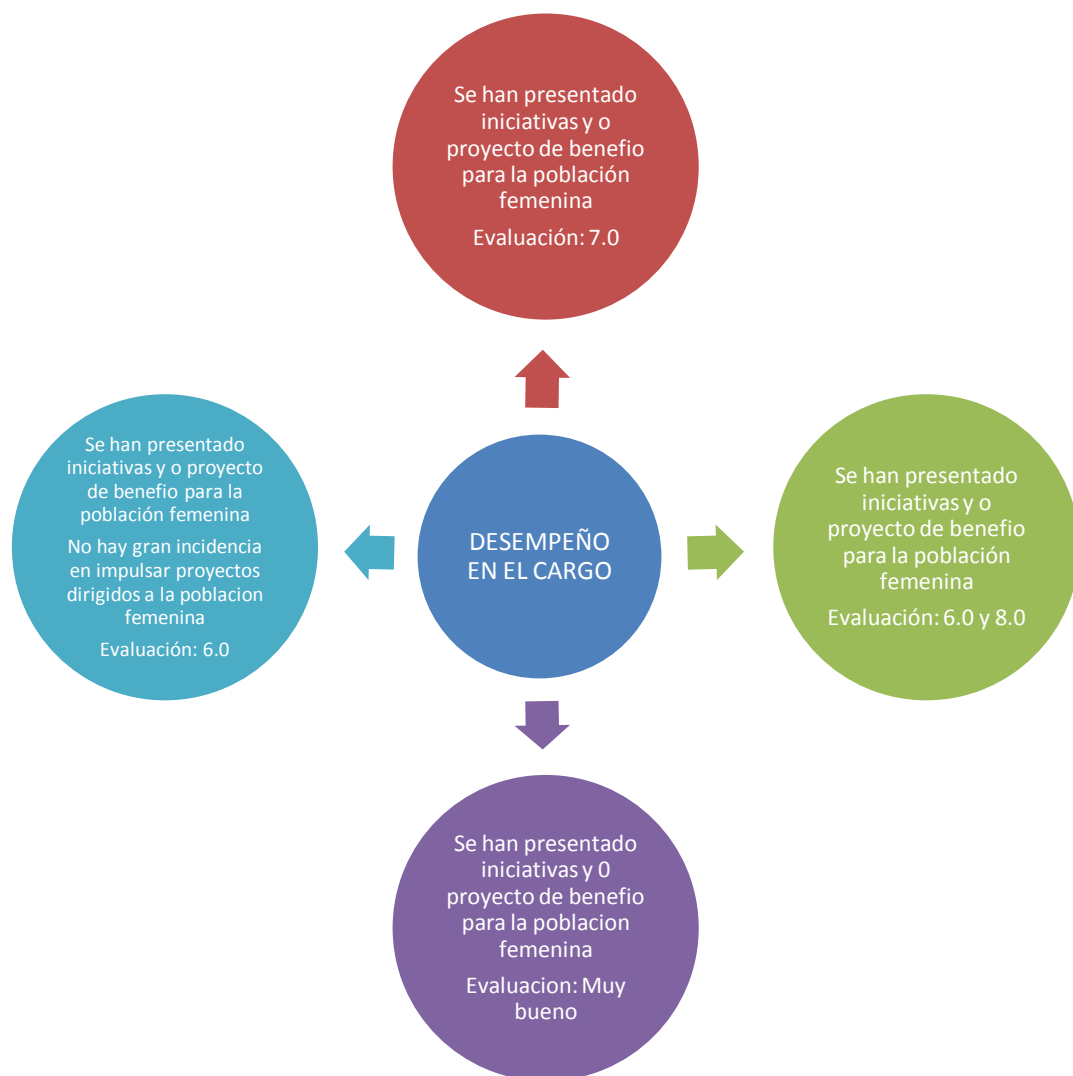
DIAGRAMA 1: VALORACIONES DE LAS MUJERES PROTAGONISTAS SOBRE SU DESEMPEÑO COMO GESTORAS MUNICIPALES