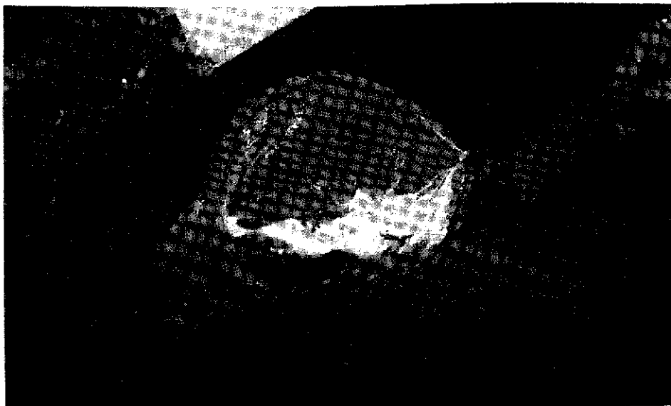
شکل ۱: ماهی کپور مقید شده، نخهای بخیه کات کوت کرومیک بصورت ساده تکی ۳۵ روز بعد از عمل در دیواره بطنی