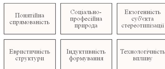
Рис. 1. Типологічні характеристики стереотипів щодо облікової інформації

Вищевказане дозволяє нам виокремити низку ознак, характерних для стереотипів, що стосуються облікової інформації (рис. 1).