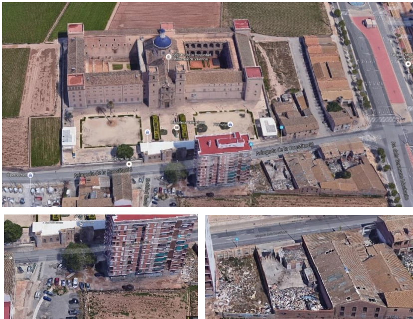
Fig. 2. Exterior del Monasterio de San Miguel de los Reyes

Fuente: Google Maps. [Consulta: 11-3-2018]