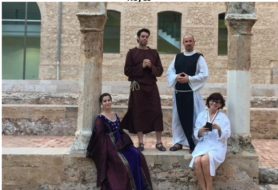
Fig. 5. Visitas teatralizadas en el Monasterio de S. Miguel de los Reyes

Este tipo de visitas teatralizadas se ha extendido también desde 2015 a algunos talleres, especialmente a los que tienen como protagonistas a niños y jóvenes que disfrutan de una visita especial realizada por personajes relacionados con el taller que realizarán y que muestran el Monasterio a través de sus ojos. Personajes como el Sombrero Loco (de Alicia en el País de las Maravillas ), el Quijote de Cervantes o Vicente Blasco Ibáñez han paseado por San Miguel de los Reyes durante estos últimos años.