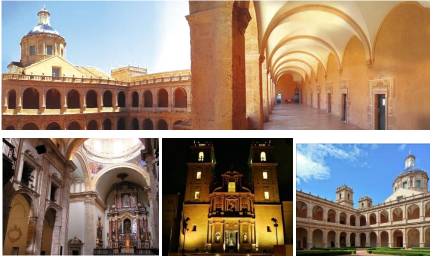
Fig. 1. Interior del Monasterio de San Miguel de los Reyes