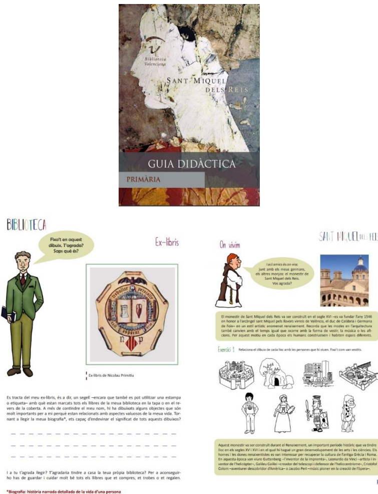
Fig. 3. Guía didáctica para Primaria