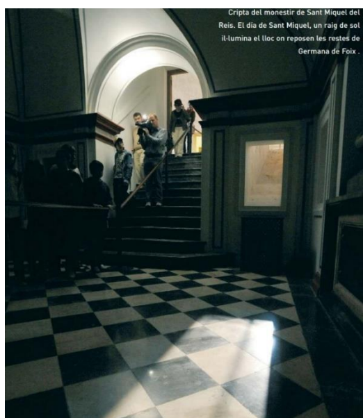
Fig. 4. Cripta del Monasterio de San Miguel de los Reyes durante la II Jornadas de Puertas Abiertas (29-IX-2008)

Fuente: LÓPEZ HANDRICH, Blanca; MUÑOZ FELIU, Miguel C. 2008. San Miguel de los Reyes muestra sus secretos. Revista de la Biblioteca Valenciana , 17, p. 19.