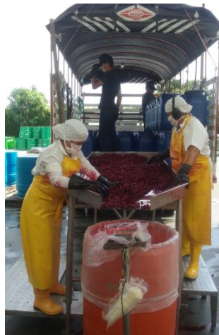
Imagen 3: Revisión de la mora en la planta de Tuluá