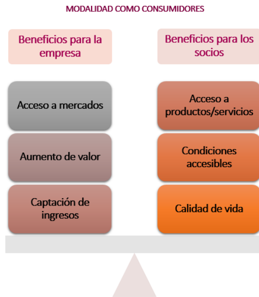
Gráfico 3: Beneficios en la modalidad de consumidores