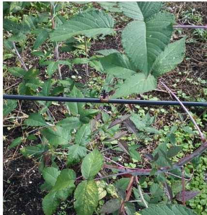
Imagen 5. Sistema de riego Amorquín

De esta manera, métodos como los sistemas de riego se han convertido en la respuesta más acertada y eficiente para combatir las condiciones externas y de igual manera optimizar procesos y recursos.