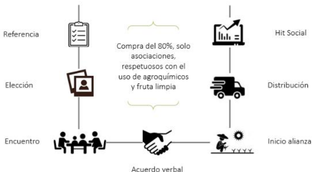
Gráfico 6: Proceso de relacionamiento