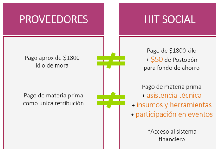
Gráfico 5. Características modelo de intervención de Postobón

El modelo de intervención de Postobón, comparado con un modelo de relacionamiento convencional proveedor-comprador, se enfoca en 3 características principales que son precio, asistencia y herramientas y facilidades económicas y financieras. Esta diferencia se ilustra en el siguiente gráfico: