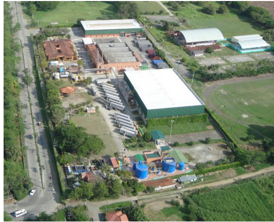
Imagen 2: Planta Nutrium Tuluá

Esta fruta puede durar almacenada desde unas horas hasta un par de días en los cuartos fríos, para ser enviada posteriormente a diferentes plantas donde se fabrican los jugos, se embotellan y se distribuyen.