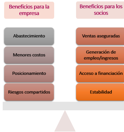
Gráfico 4: Beneficios en la modalidad de socios, proveedores o distribuidores