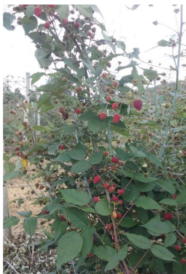
Imagen 4: Plantas de mora