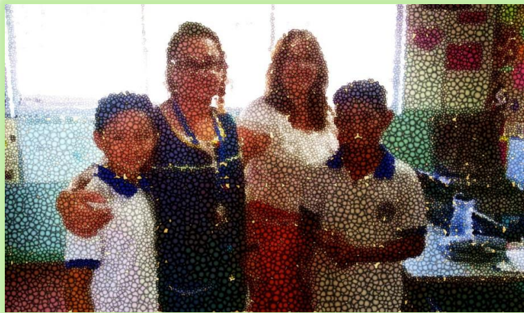
Imagen 3. Estudiantes del aula de Aceleración

Fuente 3: Estudiantes del aula de Aceleración; Registro Fotográfico Camargo y Valencia (2016)