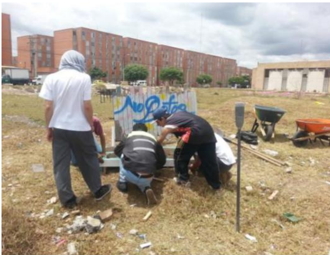
Ilustración 7. Centro de desarrollo comunitario de Bosa.

Uno de los procesos que más tiene arraigado Golpe de Barrio es el de reivindicación del territorio, de esta manera y en unión de muchas manos, se teje la restauración y se reclaman los espacios comunes, espacios verdes, localizados en Bosa que se convierten en basureros y potreros, cambiando en sí su esencia de espacios de naturaleza, que son convertidos en albergadores de problemáticas como el tema de la inseguridad para la misma comunidad.