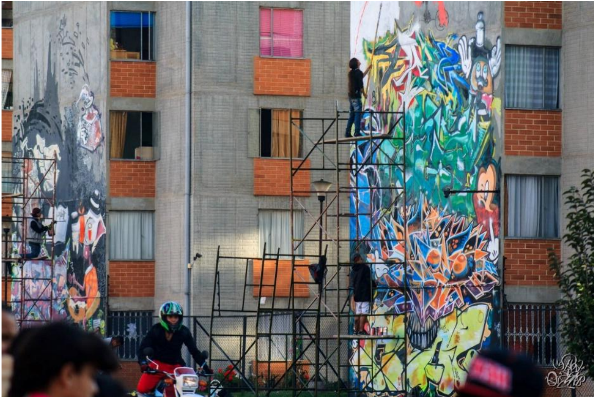
Ilustración 5 festival golpe de barrio

Lo anterior puede verse plasmado en la realidad del proyecto que se generó en el parque de la Carbonera a través del colectivo Golpe de barrio y asociados. Tal y como los describe el colectivo “El Rap como elemento de transformación del territorio. La acción Manos a la Carbonera inicia en julio del 2014 en la localidad Bosa en Bogotá. Es una iniciativa del colectivo Golpe de Barrio que decide intervenir un parque en estado de deterioro y abandono. Ellos desean transformar ese espacio que significa peligro y miedo para los habitantes del barrio. Se unieron a este esfuerzo los colectivos Arquitectura Expandida, la Redada, Monstruación y muchas más personas interesadas en este proceso de auto gestión” 22