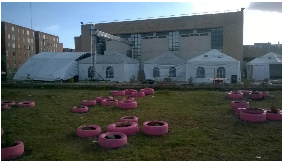
Ilustración 9. Festival Golpe de Barrio.

El festival se realiza en la zona restaurada de la que se habló anteriormente, además de esto el festival estuvo conectado por una serie de conversatorios y talleres que se vinieron dando alrededor de los 3 días del festival, estas llevaban como prioridad el conocimiento como uno de los 5 elementos que conforman el Hip Hop, entre el que fue incluido la lucha por el territorio, el fortalecimiento de la cultura, entre otros temas que generan discusión, crítica y unión. Demostrando una vez más que el Hip Hop sin unión no surge, la música, el grafiti o el Break Dance no es nada sin acción y fuerza.