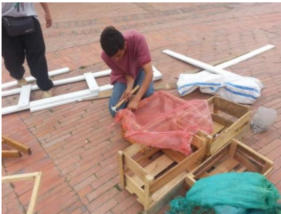
Ilustración 8. Centro de desarrollo comunitario de Bosa, proyecto para la transformación de espacios.

Para realizar la reivindicación del espacio, se crearon estrategias ecológicas, como la creación de materas hechas con materiales reciclables, como llantas e incluso con los mismos escombros que la comunidad deja en el lugar, se extendió así la idea de un semillero.