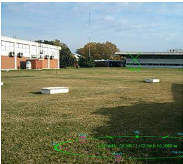
Figura 2. Visualización utilizando RAIOM

Input permite que se puedan ingresar datos al sistema por medio de voz o gestos. El módulo Visualization (figura 2) se encarga del filtrado de información prioritaria corresponde a aquellos datos que el operador puede visualizar como primer capa de información contextual. El módulo Vision tiene por objetivo brindar las implementaciones de las funcionalidades necesarias para el reconocimiento de objetos.