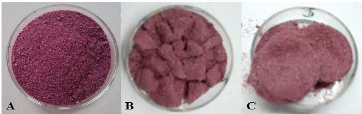
Figura 2. Bebida en polvo. A. Inicial; B. 40°C y a_w = 0.423 ; C. 40°C y a_w = 0.54 .