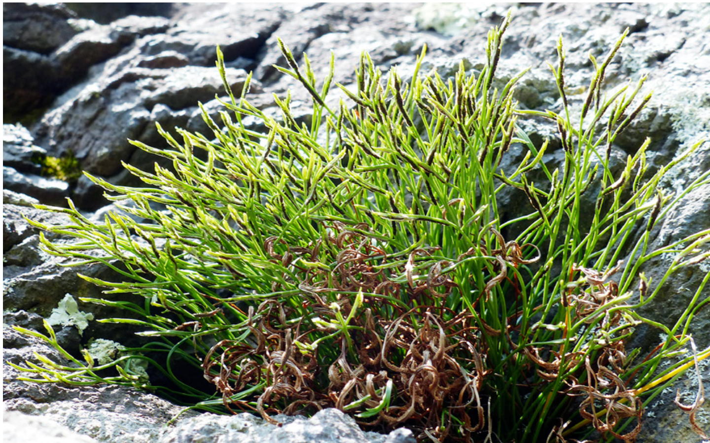
Der kalkflüchtige Nordische Streifenfarn ( Asplenium septentrionale ) kommt im Mittelland und Jura ausschliesslich auf sauren, silikatischen Findlingen vor.

Eine Flaggschiffart für die Findlingsflora im Mittelland und Jura