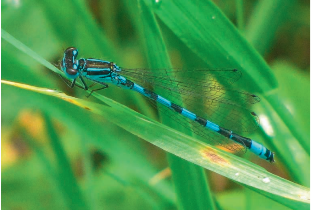
Abb. 1. Männchen von Coenagrion mercuriale .