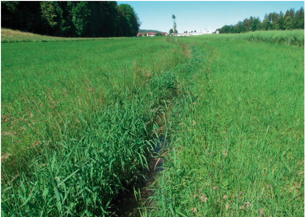
Abb. 2. Habitat von Coenagrion mercuriale im Smaragd-Gebiet Oberaargau: langsam fließende, offene Wiesenbäche mit reichlicher Wasservegetation.