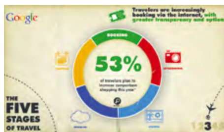
Fig.: Google's 5 stages of travel.

advanced analytics tools to model the online behavior of customers of several large international hotel chains, seeking to find patterns in individual paths from dreaming to booking and, eventually, purchasing. For instance, we found that the longer a customer is interacting with the booking site, the more likely he or she is to purchase. The potential to accurately identify the intention of the customer and their position in the 5 Stages of Travel cycle will drive a targeted personalization of the content of the online booking platform. The novel development of dynamic recommendation algorithms for the hospitality business are developed at IAS with the support from the CTI grant 19319.2 PFES-ES. ■