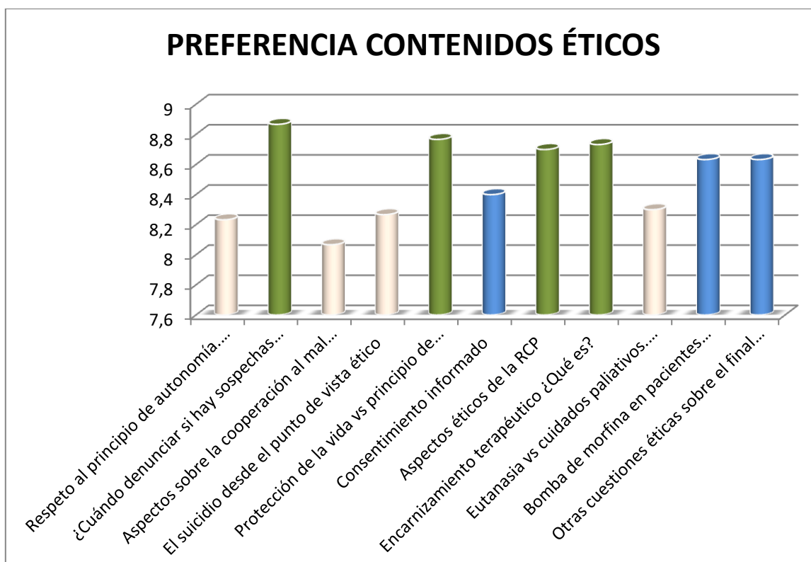
Tabla 2. Resultados dimensión preferencia contenidos éticos