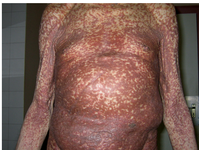
2. ábra | Urticaria pigmentosa 40 éves fennállás után